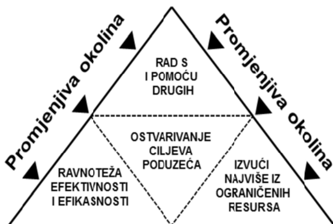
Slika 1: Ključni aspekti menadžment procesa (Kreitner, 1989, 10)

Menadžment bi se mogao definirati kao aktivnost usmjerena na postizanje određenih, unaprijed zacrtanih ciljeva, ali i aktivnosti drugih ljudi 1 . Pri tome se velika važnost pridaje efikasnom korištenju ljudskih, materijalnih i financijskih resursa. Prema Kreitneru 2 , menadžment je proces rada s drugima i pomoću drugih na ostvarenju organizacijskih ciljeva u promjenljivoj okolini uz efektivnu i efikasnu uporabu ograničenih resursa.