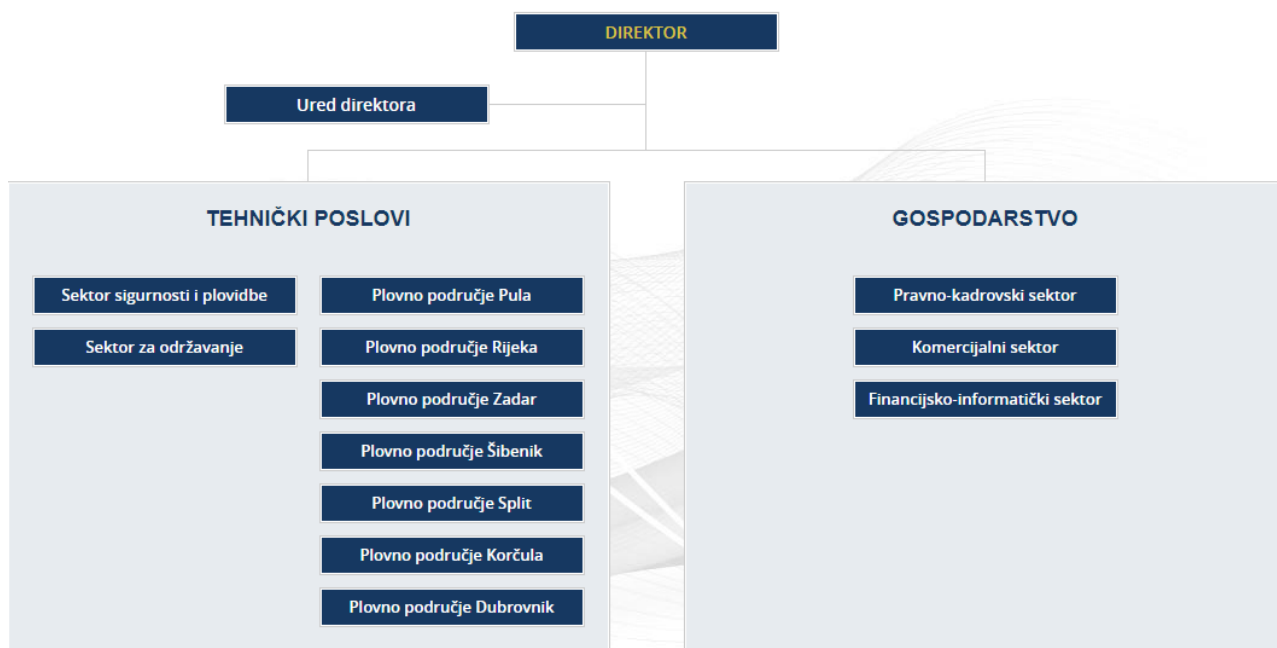
Slika 6: Ustroj Plovputa

Ustroj Plovputa prikazan je na slici 6 u nastavku.