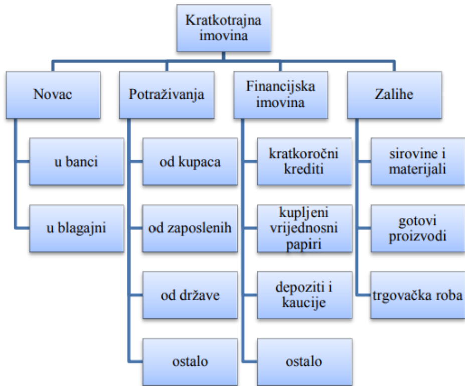
Slika 2: Podjela kratkotrajne imovine