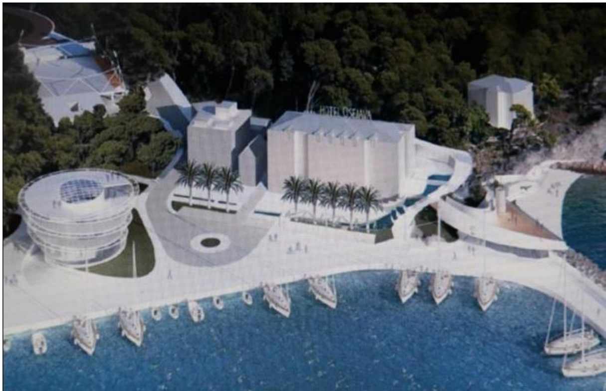
Slika 4. PROJEKT "BUROLINA"