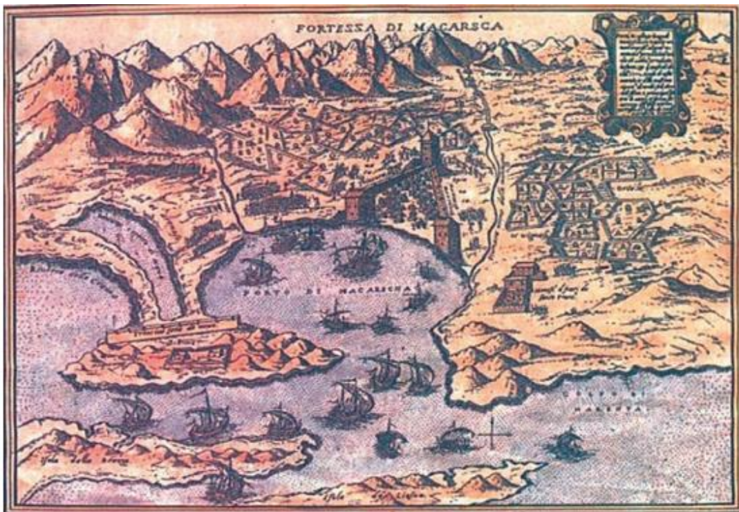
Slika 1. PRIKAZ MAKARSKE ZA VRIJEME TURSKE VLADAVINE