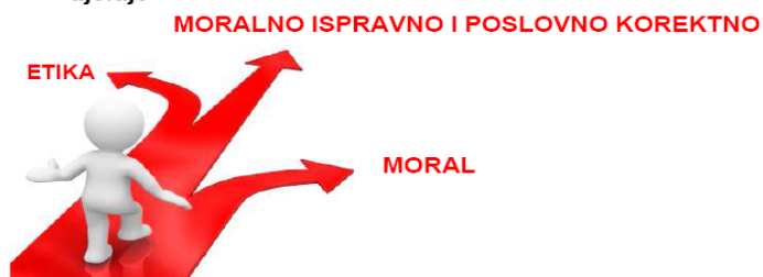
Slika 1. Etika i moral

Bez obzira o kojoj se etici radilo ona uvijek ima zadatak da se djeluje