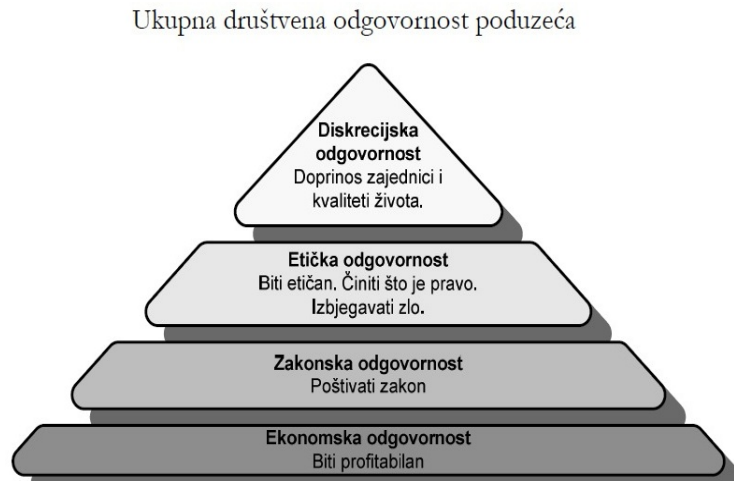
Slika 5. Hijerarhija društvene odgovornosti poduzeća (Daft, 1997, 154)

Razlikujemo četiri razine društveno odgovornog poslovanja koje imaju svoju hijerarhiju i dijele se ovisno o njihovoj veličini i tome koliko im često menadžeri pristupaju prilikom donošenja poslovnih odluka. 64