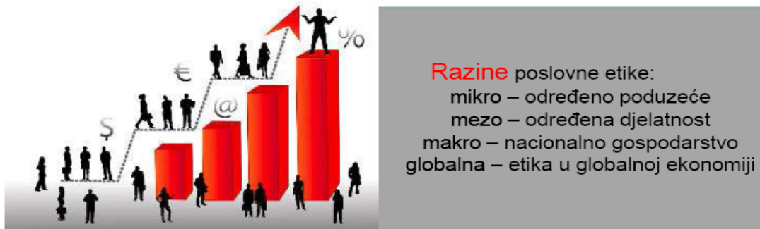
Slika 3. Razine poslovne etike

Poslovna etika je primjena etičkih principa u poslovnim odnosima i aktivnostima.