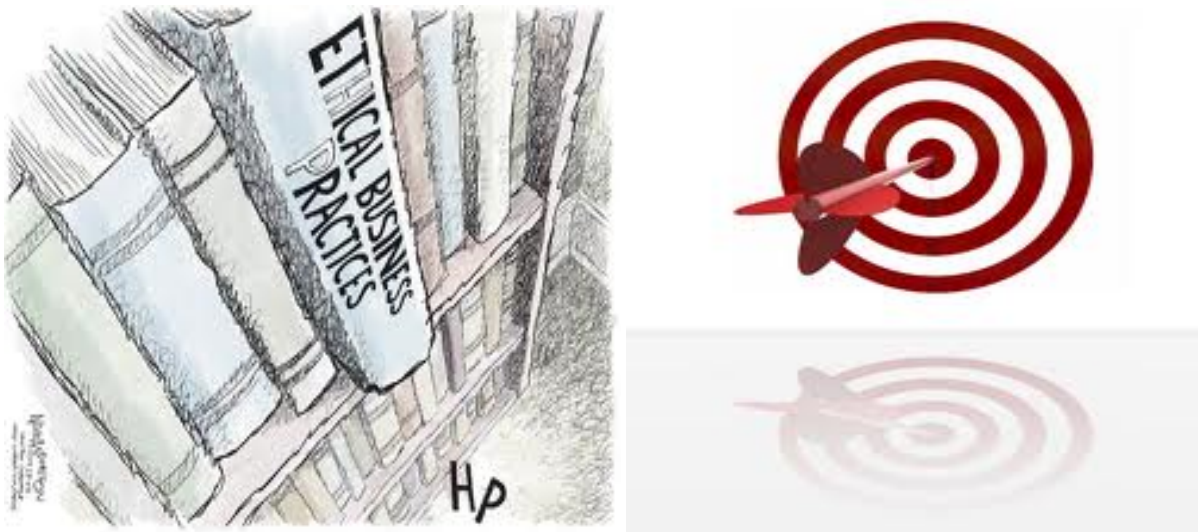
Slika 2. Poslovna etika

moralnih standarada ponašanja i etičkih sustava vrednovanja, tako da svaka osoba može formirati vlastitu kvalitetnu poslovnu odluku koja ima utjecaja na druge. 29