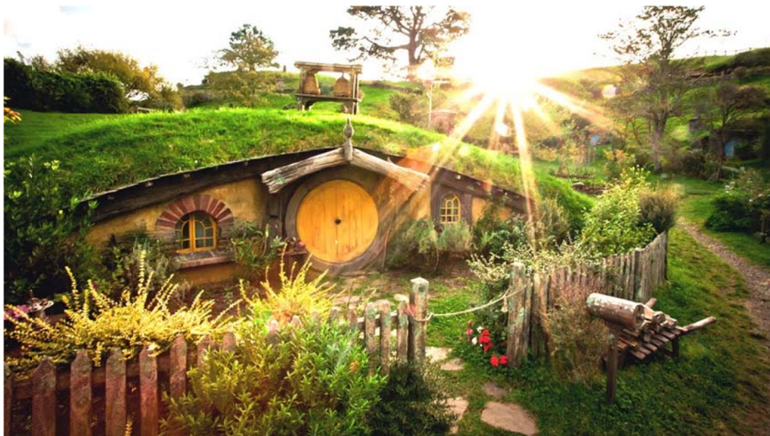
Slika 2 Selo u kojem je Frodo odrastao, The Shire

Film Gospodar prstenova je donio mnogo prednosti Novom Zelandu; a najvažnija stvar je da je postao prepoznat u svijetu.