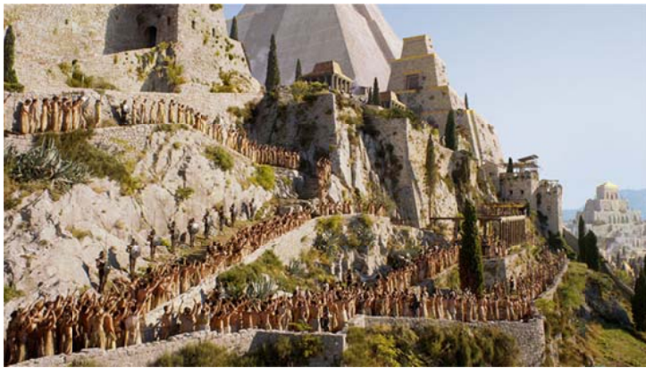
Slika 6 Grad Meereen (Tvrđava Klis)

zmajeve u seriji (Game of Thrones Wiki, 2017.).