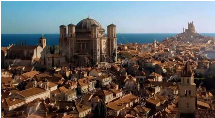
Slika 4 Pogled na grad Kraljev Grudobran (Dubrovnik)

Bogata i iznimno očuvana dubrovačka kulturna i arhitektonska baština sjajno se uklopila u srednjovjekovni kontekst serije, zbog čega se snimke dubrovačkih gradskih zidina, Lovrijenca i Lokruma često pojavljuju u serijalu. Plaža Šulić poprište je pomorske bitke za Blackwater, u kojoj je kralj Stannis Baratheon pokušao napasti i zaposjesti Kraljev grudobran i svrgnuti kralja Joffreyja. Renesansni arboretum u Trstenom predstavlja kraljev vrt u kojem se smišljaju zavjere, a Lovrijenac je Crvena utvrda. Na Lokrumu su se snimale scene u Quarthu, a putem do kule Minčeta hodala je i Daenerys Targaryan dok je očajnički pokušala ući u Kuću neumirućih kako bi spasila svoje zmajeve. Prizori iz serije su ostavili snažan dojam na gledatelje serijala, podižući globalnu prepoznatljivost Dubrovnika i potičući potražnju za turističkim posjetima tom gradu (Dubrovnik Digest, 2013.).