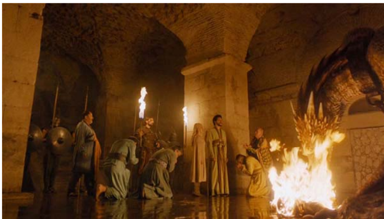
Slika 5 Dvorana u kojoj Khaleesi drži svoje zmajeve (Dioklecijanovi podrumi)

Osim u Dubrovniku, i Split je poslužio kao lokacija snimanja nekih dijelova serije.