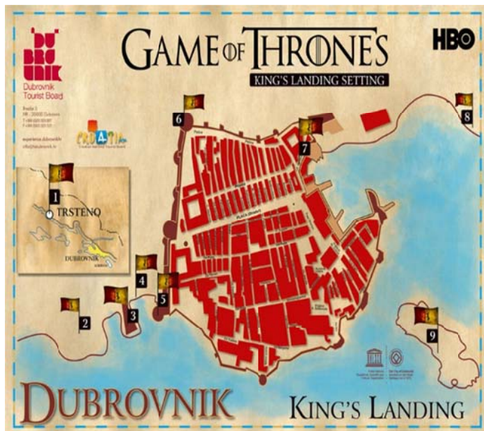
Slika 3 Karta grada Dubrovnika za lokacije snimanja Igre prijestolja