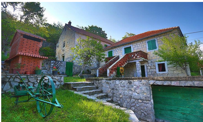
SLIKA 4: Seosko domaćinstvo Podstrana

Područje Podstrane pripada zoni ugodne sredozemne klime što pogoduje u poljoprivredi uzgoju svih mediteranskih kultura: maslina, vinove loze, smokve, rogača, agruma, breskve, te povrtlarstva koje zbog blage klime uspijeva tijekom cijele godine. Ljepota i blagorodnost podneblja te ekološka sačuvanost prirodnog okruženja izvorne su vrijednosti koje uživaju stanovnici Podstrane i izvrsni potencijali za razvoj turizma.