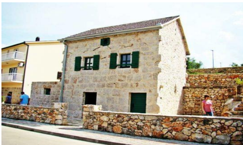
SLIKA 1: Seosko domaćinstvo Buljan