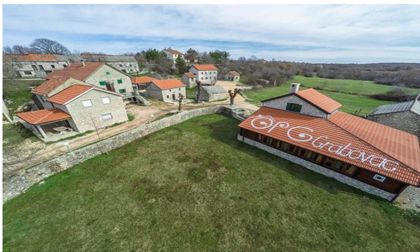
SLIKA 2: OPG Grabovac

Obiteljsko poljoprivredno gospodarstvo Grabovac se nalazi u Prološcu Gornjem, u blizini grada Imotskog. Izletišta je udaljeno 8 km od Modrog jezera i 6 km od Crvenog jezera i u potpunosti se uklapa u turističku ponudu Turističke zajednice grada Imotskog. Obitelj Grabovac svojim gostima želi dočarati nekadašnji izvorni način života ovog kraja posebnim naglaskom na izletničku destinaciju i gastronomsku ponudu.