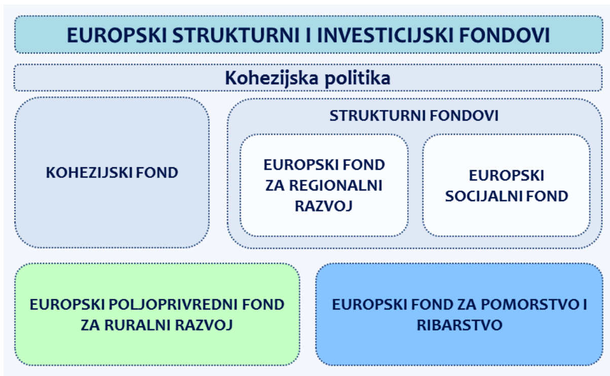
Slika 1: Shematiski prikaz Europskih strukturnih i investicijskih fondova