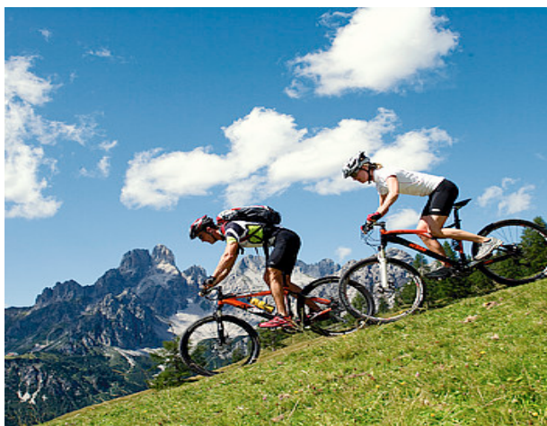
Slika 5. Brdski biciklizam