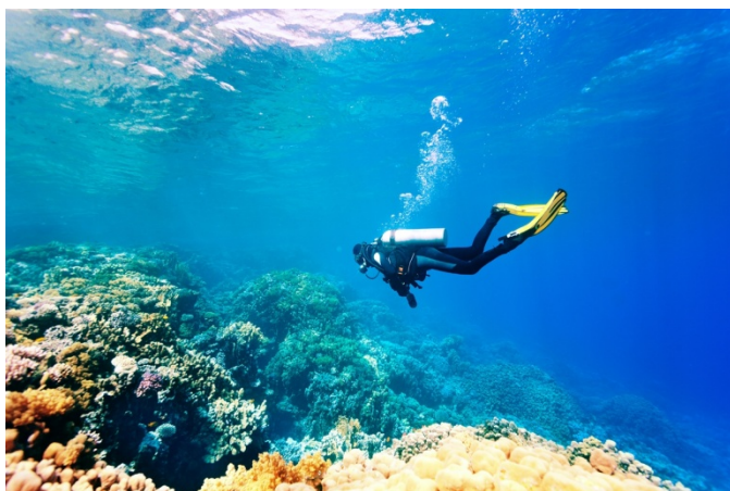
Slika 6. Ronjenje

Ronjenje je hard pustolovna aktivnost koja se najbrže širi svijetom. Ronjenje je određeno kao ljudska aktivnost ispod vodene površine uz zadržavanje daha pri uronu ili uz upotrebu ronilačke opreme 15 .