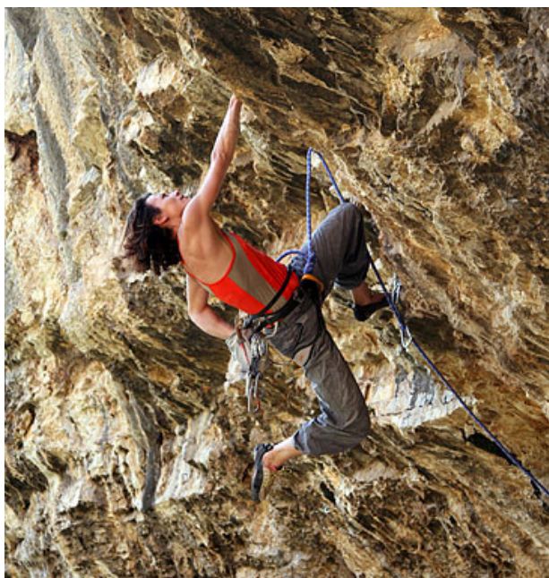
Slika 2. Slobodno penjanje