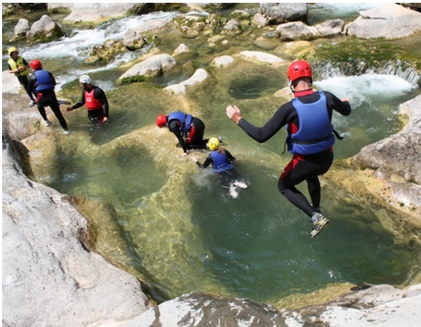
Slika 3. Kanjoning na rijeci Cetini

Kanjoning je hard pustolovna aktivnost koja označava put kroz kanjon uz korištenje različitih tehnika koje mogu uključivati hodanje, penjanje, skakanje, plivanje, te i mnoštvo drugih aktivnosti. Iako sam pojam kanjoning označava „hodanje kroz kanjon“, u užem smislu ova aktivnost uključuje tehničko spuštanje koje pak zahtjeva planinarsku opremu. Također, često zahtjeva discipline poput navigacije, traženje ruta i druge stvari vezane za putovanje kroz divljinu 12 .