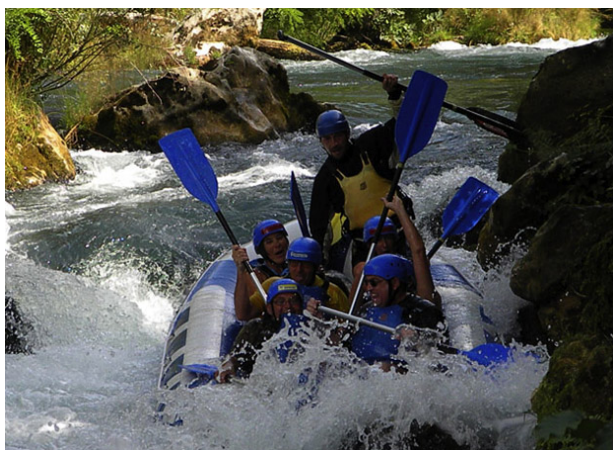
Slika 4. Rafting na Cetini