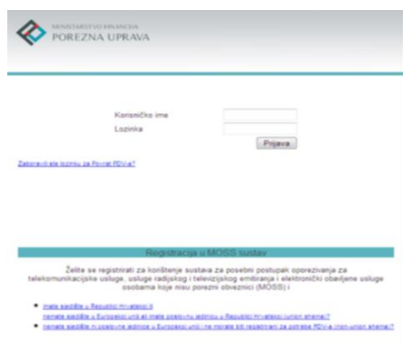
Slika 1. Union shema