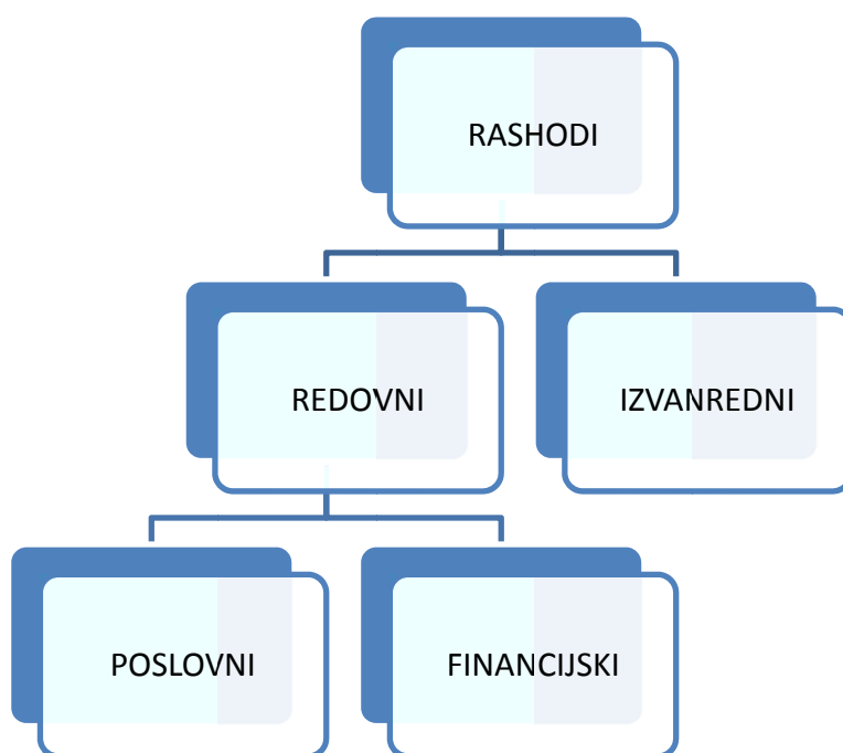
Grafikon 2 : Struktura rashoda

RASHODI 5 čine negativnu komponentu financijskog rezultata. Nastaju kao posljedica trošenja, odnosno smanjenja imovine ili povećanja obveza. Imaju utjecaja na smanjenje glavnice ili kapitala poduzeća.