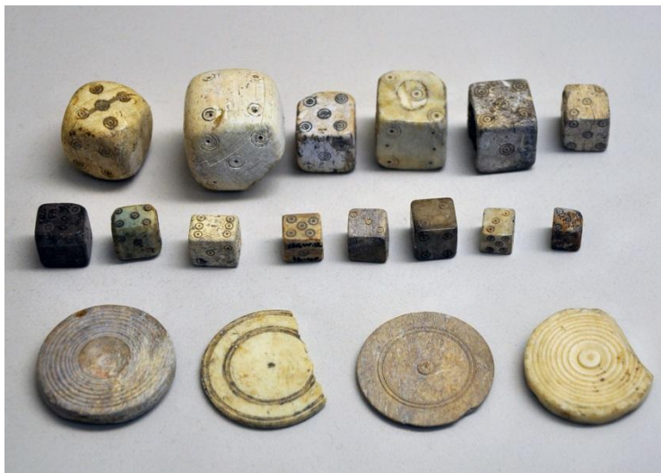
Slika 2: Starorimski kockarski pribor- kocke i žetoni