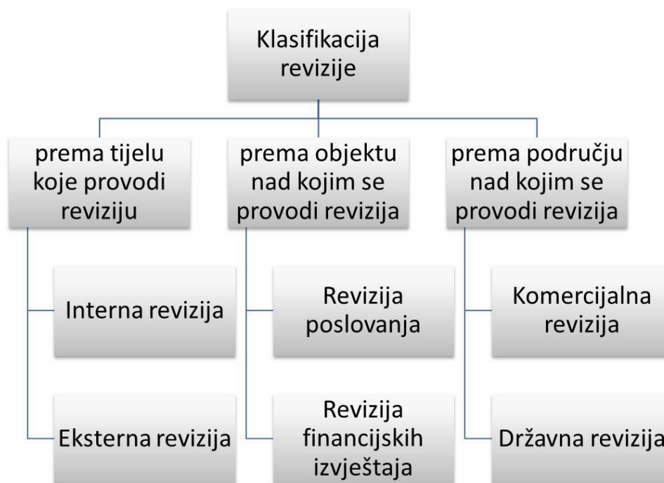
Slika 1: Klasifikacija revizije