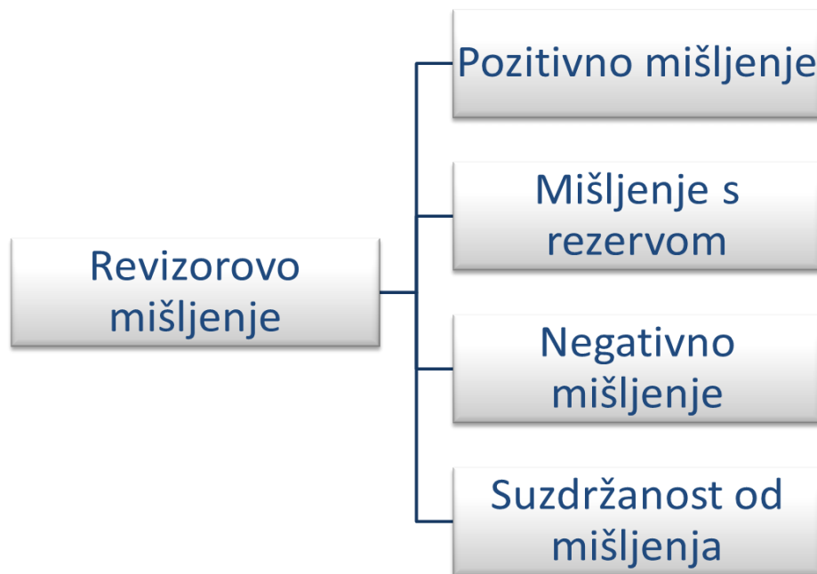
Slika 5: Vrste revizorova mišljenja

Na slici 5. prikazane su vrste revizorova mišljenja.