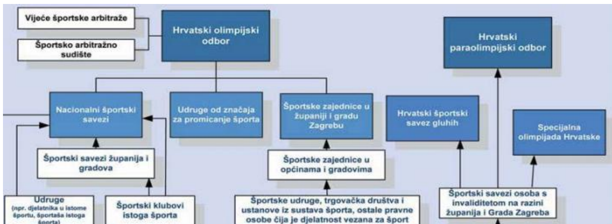
Slika 2: Organizacija i upravljanje sportom u Republici Hrvatskoj