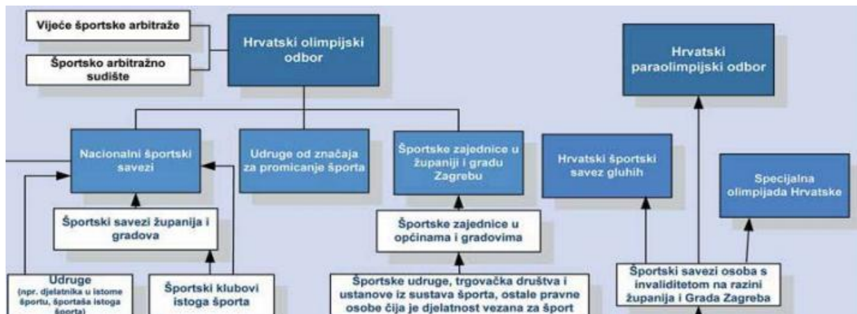
Slika 2: Organizacija i upravljanje sportom u Republici Hrvatskoj