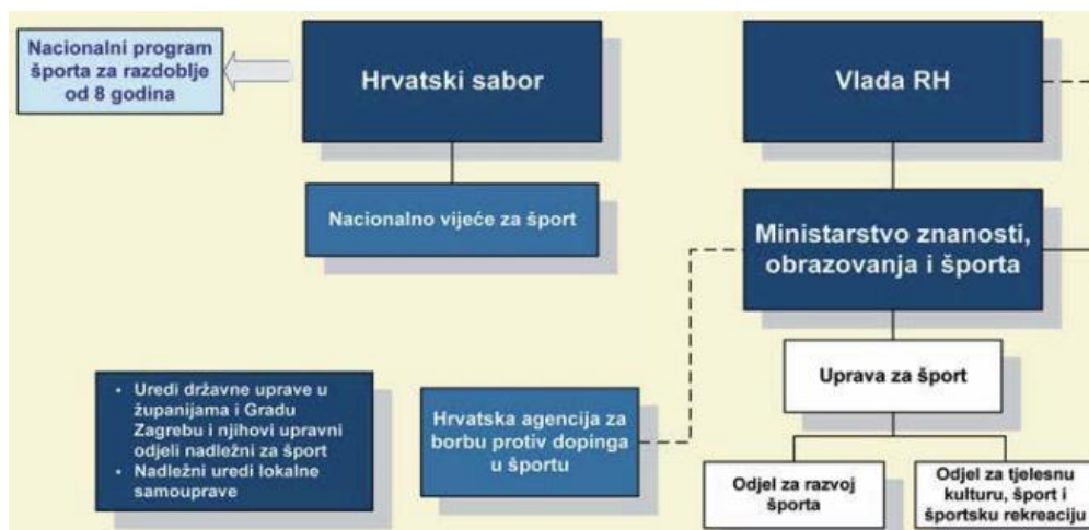
Slika 1: Organizacija i upravljanje sportom u Republici Hrvatskoj

Utvrđujući sportske djelatnosti koje su definirane Zakonom o športu, kroz natjecateljski sport spominjali sportske klubove koji čine temelj te djelatnosti. Sportski klubovi čine temelj i „piramide“ ustroja sporta te su od fundamentalne važnosti, udruženi i grupirani kroz razne športske saveze, lokalne, regionalne i naposljetku državne.