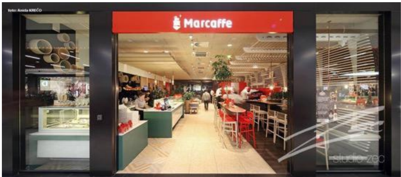
Slika br. 14: Marcaffè CoffeeShop Tuzla

Djelatnosti kojima se poduzeće bavi su primarno prodaja kave te prodaja instant napitaka. Pored toga, velik dio posla radi se i sa samouslužnim aparatim. Poduzeće snabdijeva kafiće, restorane i ostale uslužne objekte kojima daje svoje aparate za kavu, mlinove te reklamnu opremu. Proširenje djelatnosti dogodilo se unazad par godina kada je poduzeće otvorilo prvi kafić u Sarajevu, glavnom gradu Bosne i Hercegovine. Nakon njega uslijedilo je otvaranje istih u Tuzli te nakon toga i u Travniku. Svaki od ovih kafića nudi gostima mogućnost kupovine svih proizvoda u njima.