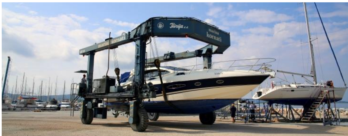
Slika 4. Servis zona marine Kornati

Cijena lučkog servisa za brodove do 17 metara iznosi 535 eura po jednoj operaciji dizanja i dodatnih 90 eura za pranje plovila kompresorom. Ta cijena se nije mijenjala od 2013. godine što nam govori o vrlo lako uočljivom padu prometa u 2017. godini koji proporcionalno pada kao i sam promet plovila kroz marinu.