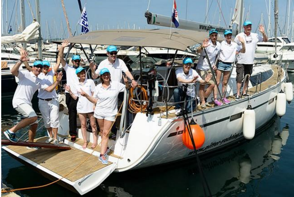
Slika 2. Čarter u marini Kornati