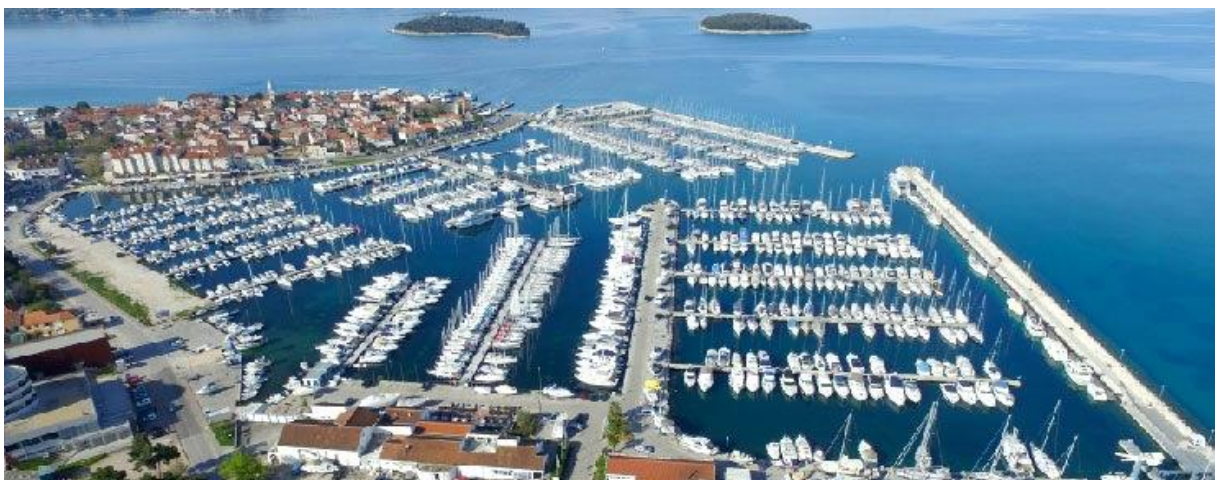
Slika 1. Marina Kornati

U marini Kornati nalaze se 854 veza koji su rasprostranjeni na 15 gatova koji su opremljeni 24satnom strujom i vodom koji su osposobljeni za prijem plovila do 23 metra duljine. U samoj marini postoji usluga vađenja brodova širine do 7 metara te usluga travel lifta do 50 tona.