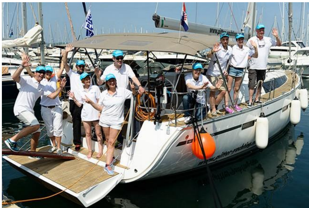
Slika 2. Čarter u marini Kornati