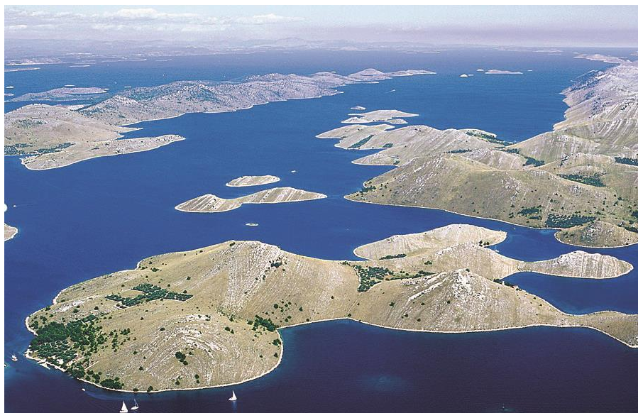
Slika 3. Nacionalni park Kornati