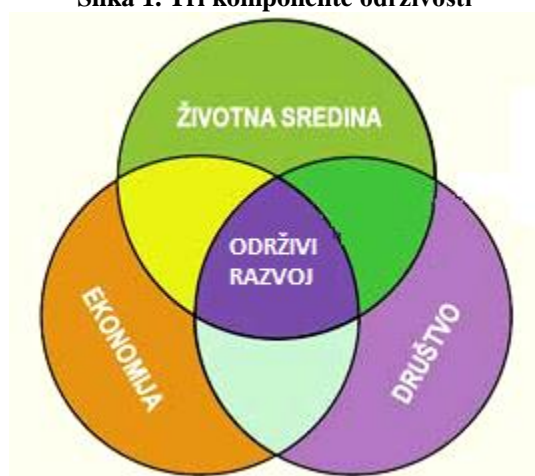
Slika 1. Tri komponente održivosti