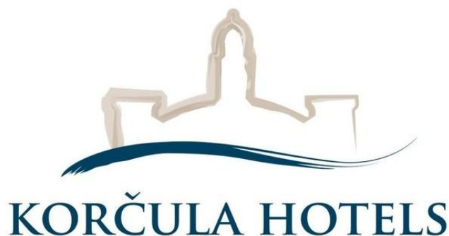
Slika 3. Logotip HTP Korčula