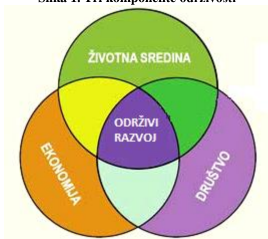
Slika 1. Tri komponente održivosti