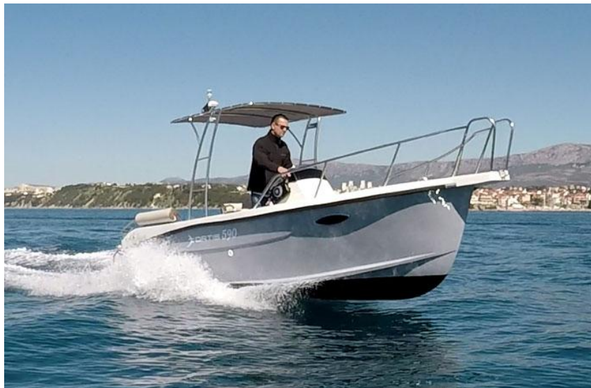
Slika 8: Fortis 590 Fisher