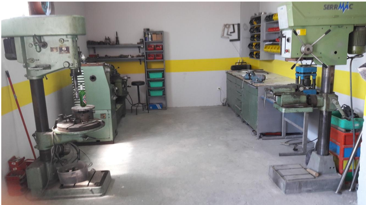
Slika 5: Interijer poduzeća

Postrojenje se nalazi u Žrnovnici u predgrađu Splita i obuhvaća 300m 2 radnog zatvorenog prostora te 200m 2 parkirališta. Poduzeće je opremljeno sa svim strojevima potrebnim za obradu cijevnog programa s težnjom da se proširi i na obradu lima, što će zahtijevati dodatan prostor, kupnju novih strojeva i pronalazak dodatnih zaposlenika.