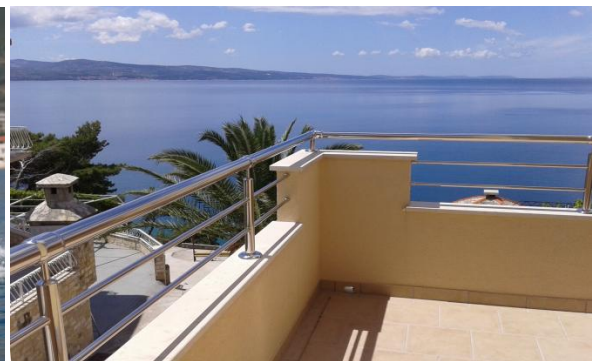
Slika 4: Inox vanjska ograda