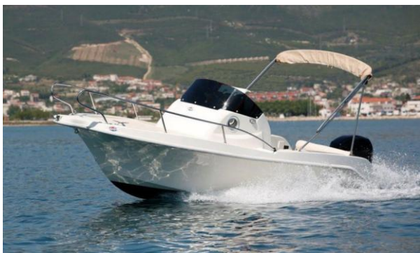
Slika 3: Sealife 535

U počecima svoga poslovanja proizvodnja je bila usmjerena na opremanje malih brodica inox-om. Opravkom i razvojem turizma poduzeće širi svoj asortiman proizvoda na komunalnu djelatnost ponajviše na interijere i eksterijere, što danas uz proizvodnju serijske nautičke opreme predstavlja okosnicu poslovanja.