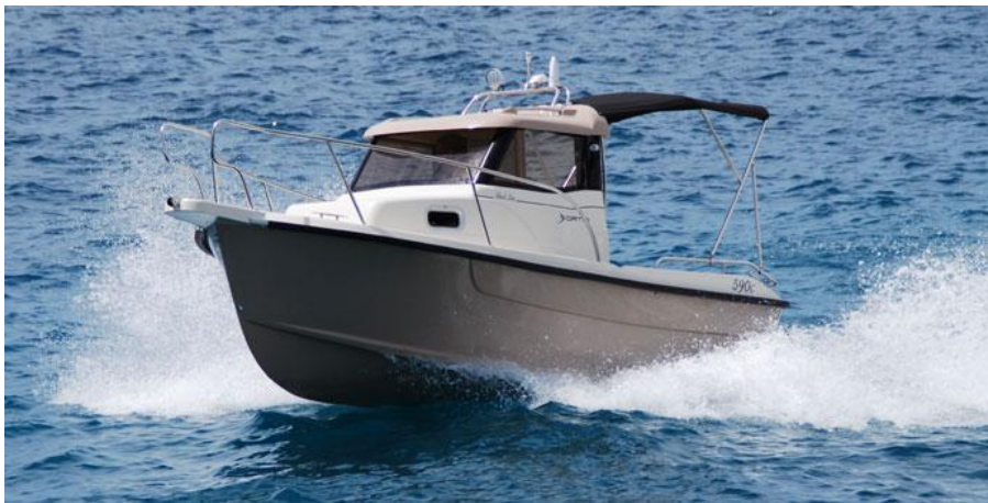
Slika 7: Fortis 590c