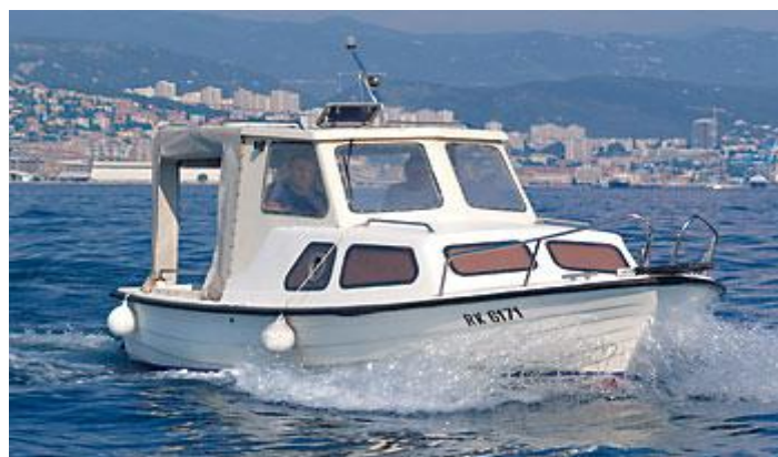
Slika 6: Promorka 630

Raspadom tih velikih poduzeća proizvodnja plovila se nastavila preko malih poduzeća koje su naslijedile patente i počele proizvoditi nove modele na staroj bazi uz neke sitne preinake, no osnovni izgled ostajao je nepromijenjen 30 i više godina.