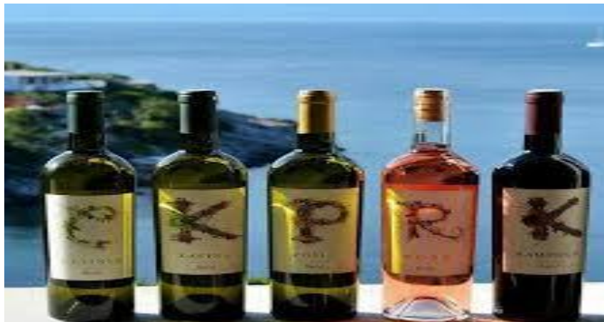
Slika 8: vina vinarije Bačić

Petar smatra da je na otoku pogodno za proizvodnju vina jer je vino proizvod koji je cijenjen u svijetu, s vremenom će poslovanje možda postati teže zbog velike konkurencije ali ujedno lakše zbog razijanja elitnog turizma sve je veći broj restorana koji traže vrhunska vina za strane i domaće goste. Ovakva vrsta turizma kako Petar kaže uvelike će im olakšati brendiranje proizvoda i jačanje tržišne cijene.