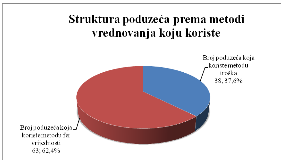
Graf 1: Prikaz strukture poduzeća prema metodi vrednovanja koju koriste

Ukupan uzorak čini 101 poduzeće od kojih 63 poduzeća primjenjuju metodu fer vrijednosti, dok 38 poduzeća primjenjuje metodu povijesnog troška. Prikaz strukture poduzeća može se vidjeti na sljedećem grafu.