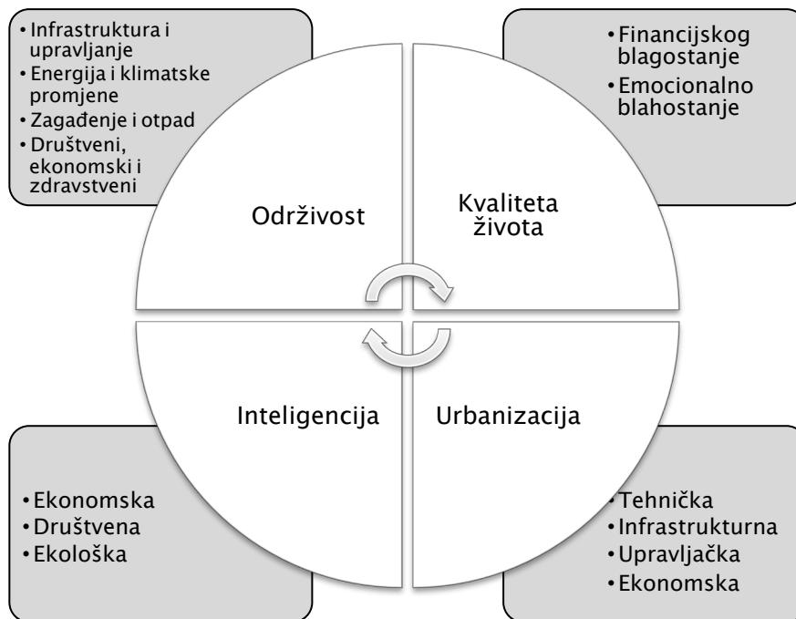
Slika 1. Karakteristike Smart City-ja