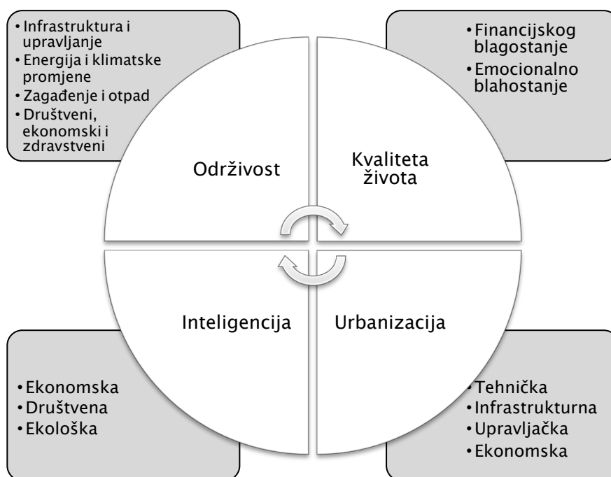
Slika 1. Karakteristike Smart City-ja

Izvor: Caragliu, A., Del Bo, C., & Nijkamp, P. (2011.) Smart cities in Europe. Journal of Urban Technology , 16(2), 65–82.