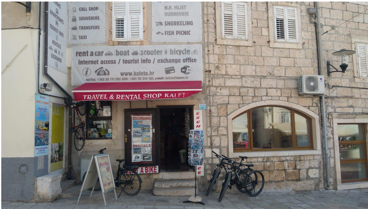
Slika br. 2 - Putnička agencija Kaleta