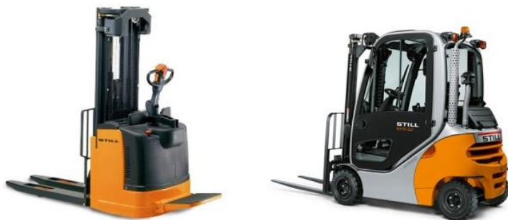
Slika 3: Električni i plinski viličar

Da bi se olakšala manipulacija robom koriste se mehanička sredstva. Zaposlenici Pema imaju na korištenje električne i plinske viličare, strech folije, paletare, kolica, euro palete, termo folije i slično. Viličari garantiraju jednostavnost kontrole, imaju lako razumljiv display i ergonomičnim oblikovanjem garantiraju skladnu interakciju između vozača i vozila. Inteligentna elektronika instrument ploče pomaže vozaču da se koncentrira na svoj osnovni posao.