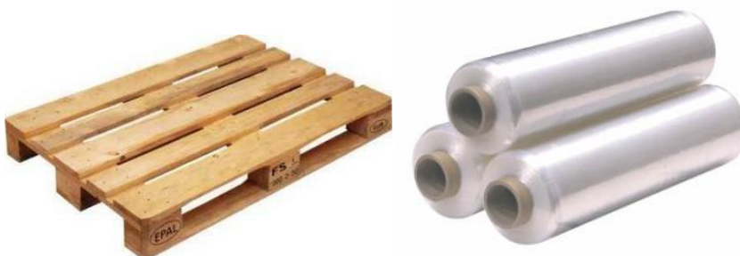
Slika 4: Euro paleta i strech folija

Prilikom skladištenja i transporta koriste se EURO palete dimenzije 1200 x 1000 mm. One su konstruirane kao dvopodne palete sa 3 ili 4 nožice koje joj pružaju otpornost pri savijanju tako da se omogući ulaz vilicama viličara na način da digne cijelu paletu i lako manipulira njome. Proizvodi na paletama se mogu različito slagati, što prvenstveno ovisi o vrsti proizvoda, pa se tako mora paziti da se lomljivi proizvodi slažu na vrh palete da se ne bi oštetili. Strech folija koristi se za stabiliziranje paletiziranog 23 tereta različitih vrsta i dimenzija te zaštita zapakirane robe od prašine i vlage. Odlično prijanjanje omogućuje lako omatanje oko proizvoda. Folija štiti proizvode od vanjskih utjecaja i mogućih oštećenja pri transportu. Osnovna karakteristika termo folije je da služi kao pokrivalo za robu na paletama koje čuvaju temperaturu u ljetnim mjesecima za lako pokvarljivu robu.