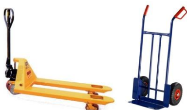
Slika 5: Ručni paletar i transportna kolica

Ručni paletar je alat koji se koristi za premještanje i podizanje kako paleta po kojima je i dobio ime, tako i ostalih teških predmeta koji nisu paletizirani. Najosnovniji je oblik viljuškara i namijenjen je za kretanje paleta unutar skladišnog prostora – magacina. Transportna kolica omogućavaju lako i jednostavno prenošenje robe poput kutija, sanduka, bačvi i vreća. Elastičnom se trakom može obuhvatiti svaki teret, neovisno o obliku i težini te optimalno pričvrstiti na kolica.