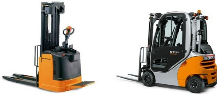
Slika 3: Električni i plinski viličar

Da bi se olakšala manipulacija robom koriste se mehanička sredstva. Zaposlenici Pema imaju na korištenje električne i plinske viličare, strech folije, paletare, kolica, euro palete, termo folije i slično. Viličari garantiraju jednostavnost kontrole, imaju lako razumljiv display i ergonomičnim oblikovanjem garantiraju skladnu interakciju između vozača i vozila. Inteligentna elektronika instrument ploče pomaže vozaču da se koncentrira na svoj osnovni posao.