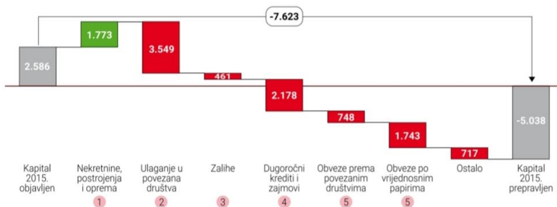
Slika 4: Promjene kapitala kompanija zbog jednokratnih otpisa i procjena (u mil)