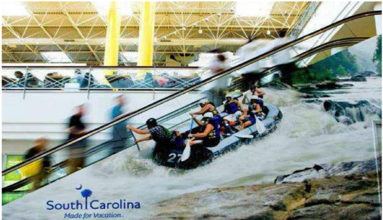
Slika 8. Turizam u Južnoj Karolini