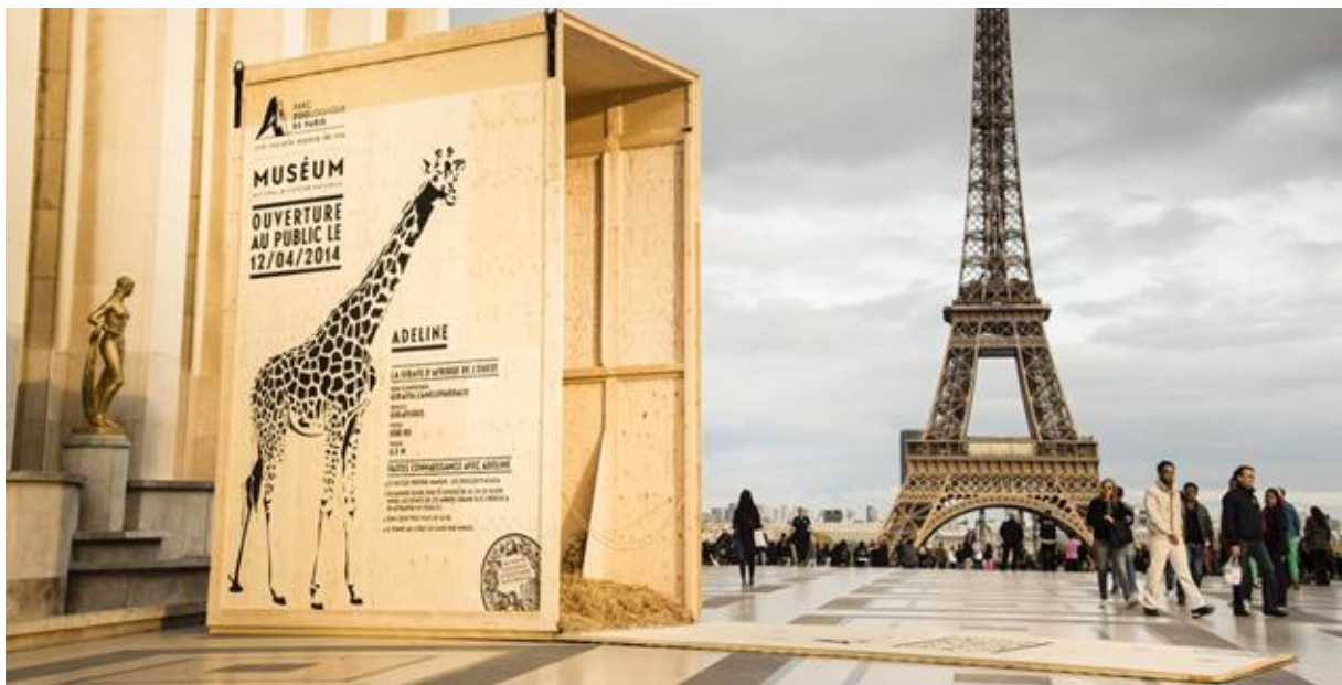
Slika 4. Zoo u Parizu

2. Drugi odličan primjer nalazi se u Parizu. Netom poslije otvorenja pariškog zoološkog vrta, na Trocaderu je postavljen otvoren kavez za životinje, konkretno žirafe, kako bi se stvorilo uzbuđenje i privuklo turiste da dođu u zoološki vrt budući da izgleda da je životinja pobjegla iz kaveza prema Eiffelovom tornju 6 .