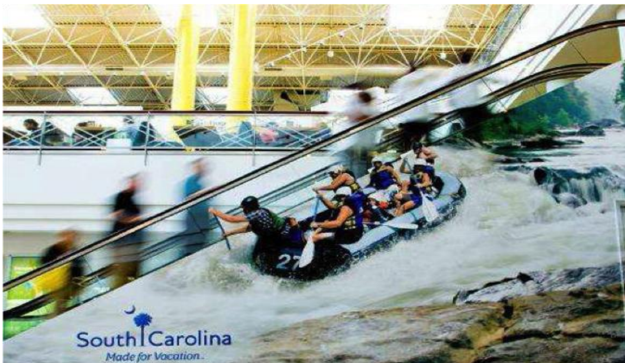
Slika 8. Turizam u Južnoj Karolini