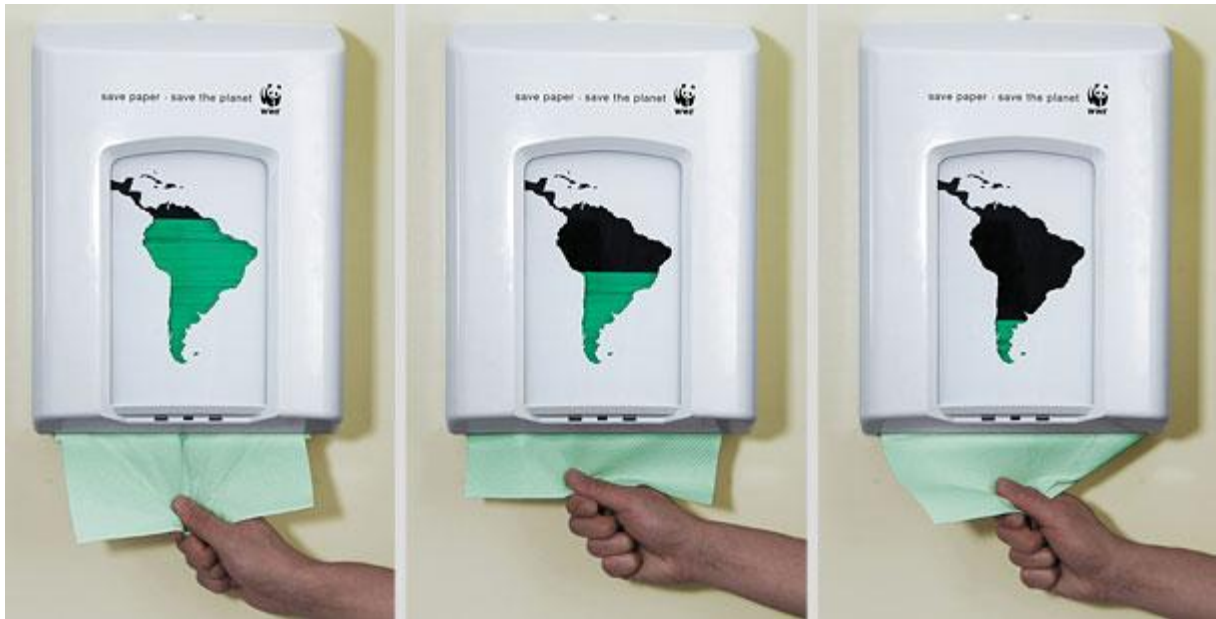
Slika 6. WWF-ova kampanja za očuvanje prašuma