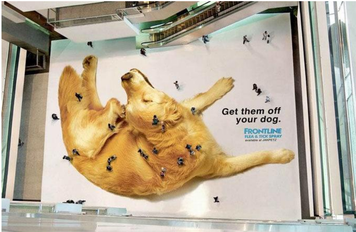
Slika 7. Kampanja tvrtke Frontline