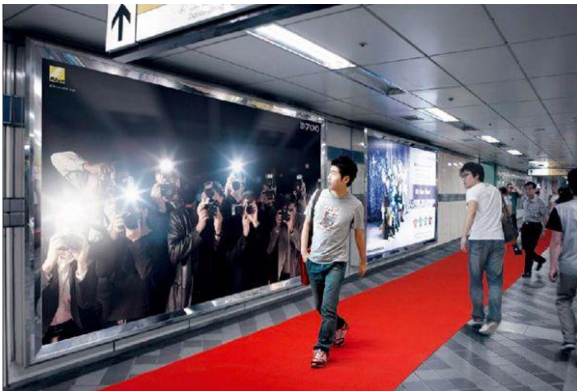
Slika 1. Kampanja za Nikon