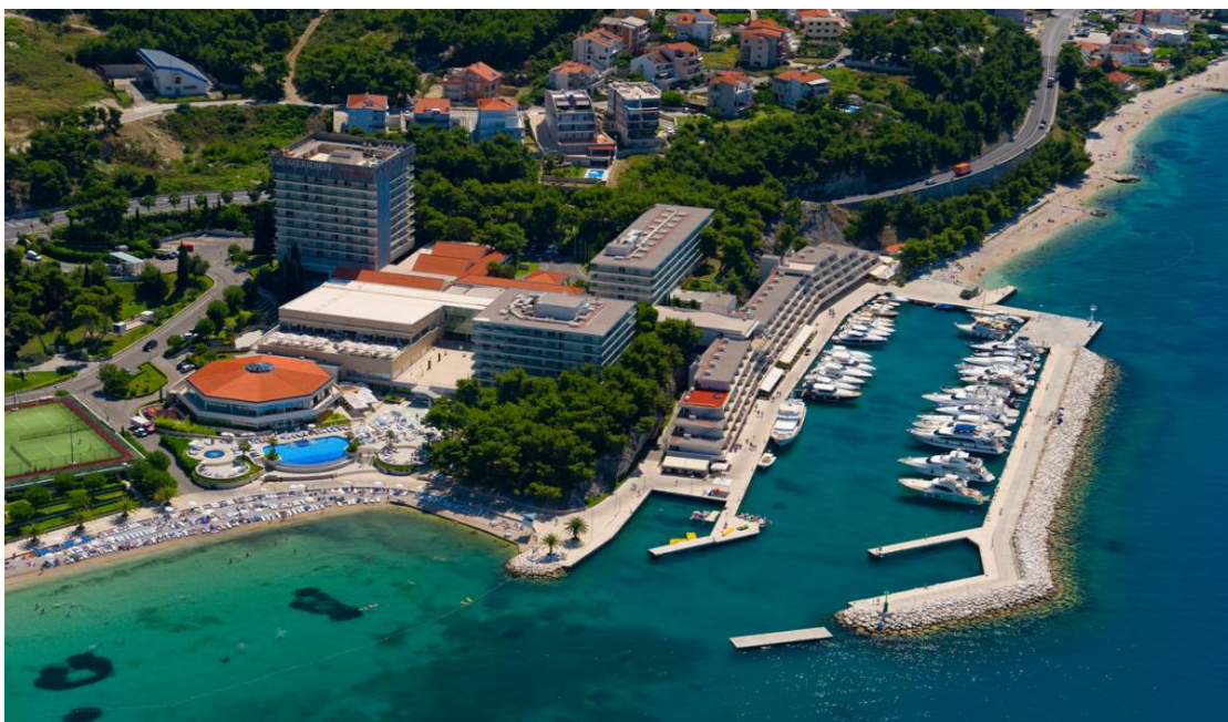
Slika 9. Hotel LeMeridien Lav