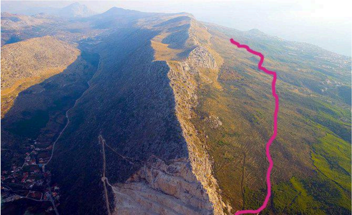
Slika 11. Planirana trasa offroad staze