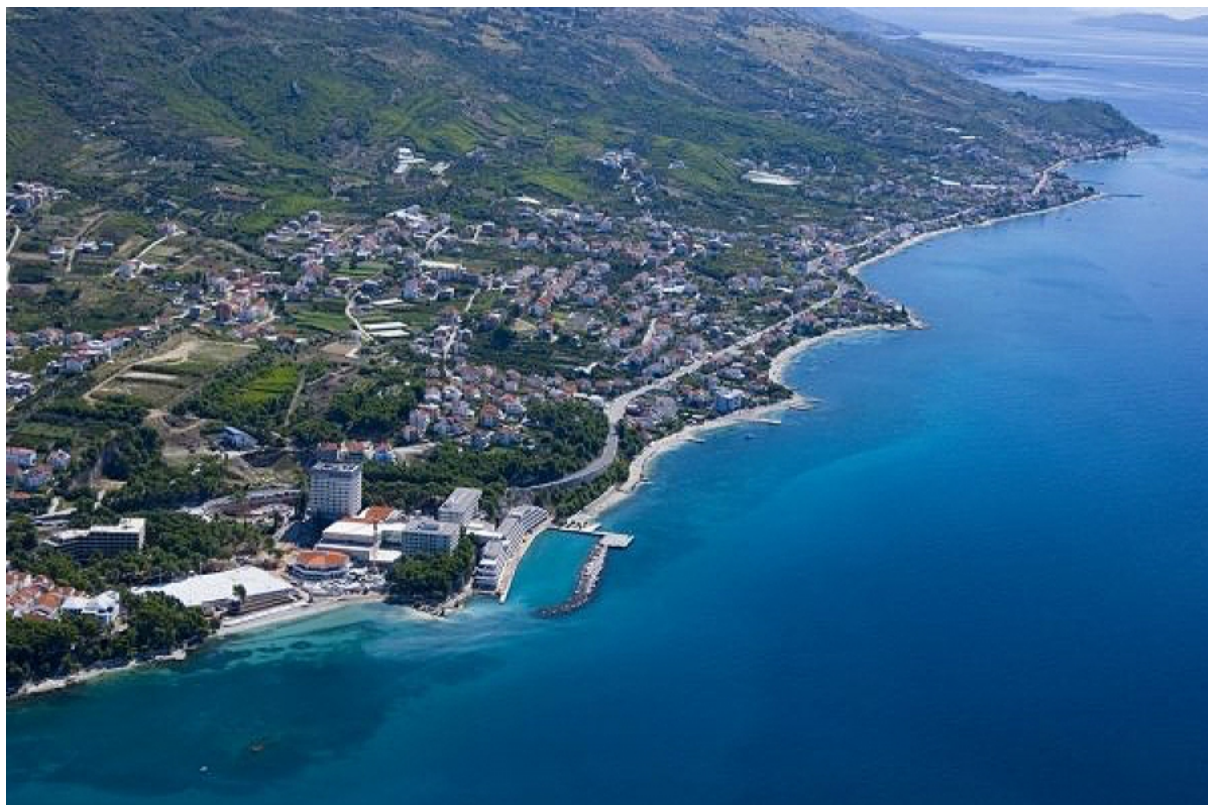
Slika 4. Obala Podstrane

Podstrana, općina koja na zapadu graniči sa gradom Splitom od čijeg je centra udaljena samo 10 kilometara, zauzima 6 kilometara dug obalni pojas u podnožju Peruna. Uz grad Split, općinu s istočne strane od grada Omiša dijeli tek 12 kilometara. Sama površina teritorija općine iznosi 11,5 četvornih kilometara, dok je širina oko 2 kilometra. 13