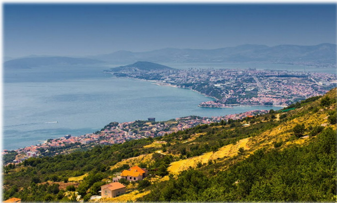
Slika 5. Gornja Podstrana (pogled)

Danas Gornja Podstrana nije naseljena kao nekada, nekadašnja kućna ognjišta prepuštena su zubu vremena, no dobar dio starina obnovljen je i moderniziran u turističke svrhe. Uredne i obnovljene ceste, šetnice, brojni putokazi i vrlo "ukusno" odabran dizajn vanjske rasvjeta ukazuju da ovo mjesto razmišlja turistički i to na način da uvažava tradiciju i prirodnu ljepotu.