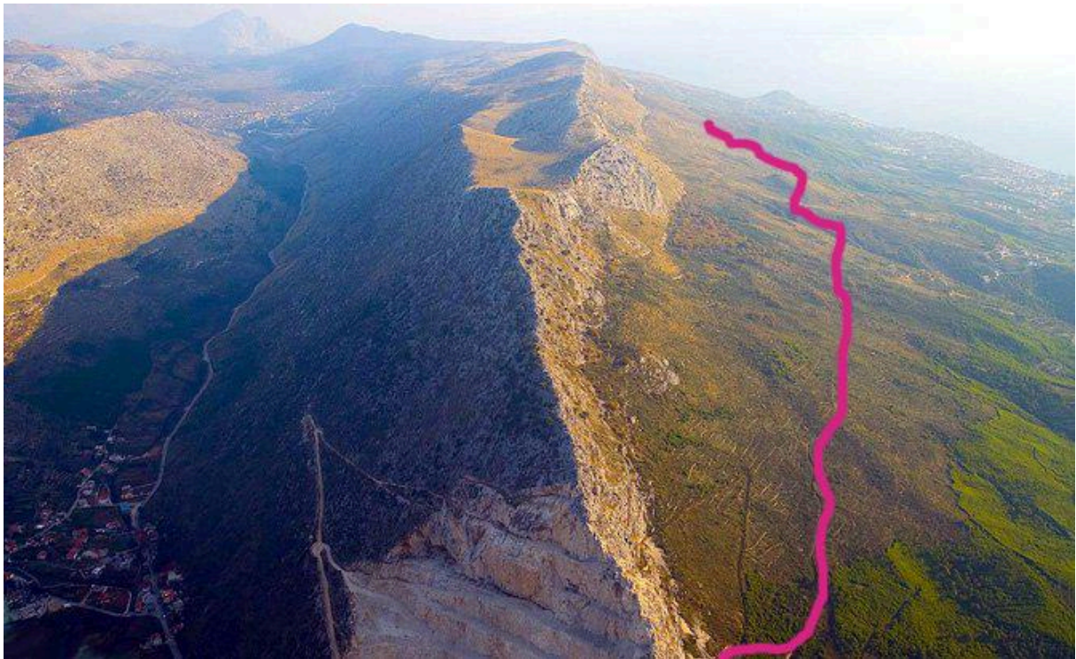
Slika 11. Planirana trasa offroad staze