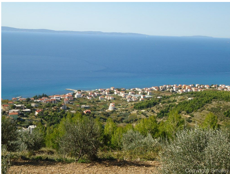
Slika 8. Gornja Podstrana