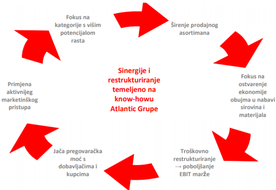
Slika 2.: Strateški razlozi za akviziciju Droga Kolinske