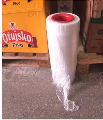
Slika 10: Stretch folija