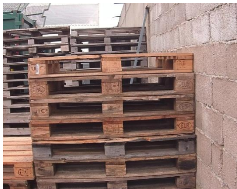
Slika 11: Euro palete

U ovom prodajno-distribucijskom centru se koriste euro i industrijske palete. Obje vrste paleta koje se koriste su dimenzija 800x1200 mm. To su ravne palete izrađene od drveta i namijenjene za višekratnu upotrebu. Palete olakšavaju rukovanje robom i njeno premještanje do transportnog vozila. Djelatnici u ovom centru premještaju palete s robom pomoću viličara. Viličar je vozilo koje služi za dizanje i spuštanje paleta, a koristi se tako da vilice ovog vozila prođu ispod paleta i zatim je podignu kako bi paletu prenijelo do potrebnog mjesta. Kad se roba dostavi kupcu, kupac mora prodajno-distribucijskom centru vratiti palete. Ba-com također vraća palete dobavljačima nakon što se zaprimi roba, jer u suprotnom dobavljač financijski zaduži Ba-com za te palete.