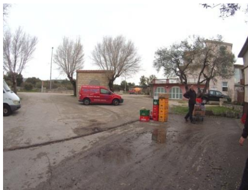
Slika 8: okolina skladišta

Skladište je locirano na ulazu u Rogoznicu, što je izrazito blizu kupcima robe na područjima prema Šibeniku. Lokacija i okolina skladišta su jako važni kako bi se olakšao prijevoz robe i smanjilo vrijeme dostave. U ovom prodajno-distribucijskom centru je pogodno što se skladište nalazi u neposrednoj blizini Jadranske magistrale, s koje se može direktno pristupiti centru. U krugu skladišta se nalazi prostrani parking za vozila centra, sa dovoljno parkirnih mjesta za dobavljače i za kupce.