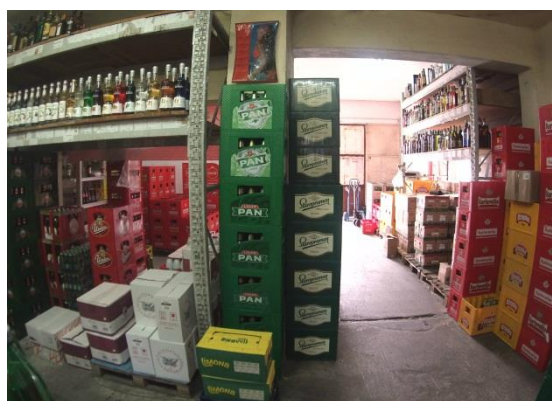
Slika 9: Unutrašnji dio skladišta

Unutar skladišta se nalaze materijali potrebni za prodaju i gotovi proizvodi, odnosno alkoholna i bezalkoholna pića. Dio robe je smješten po policama metalne strukture, s drvenim plohamama. Ostatak robe je upakiran u transportnu ambalažu i smješten na paletama ili na podu, ako su u pitanju pive. Prilikom raspoređivanja robe po skladištu, skladištari se drže određenih pravila. S obzirom da je dio pića upakiran u staklene ambalaže, izrazito je važno da se roba smješta po skladištu sa pažnjom i oprezom kako ne bi došlo do lomova. Roba koja se češće izdaje iz skladišta, smješta se što bliže ulazu u skladište kako bi se olakšao posao i smanjilo vrijeme potrebno za izdavanje robe. Roba koja se rjeđe prodaje se smješta prema stražnjem dijelu skladišta. Kod slaganja robe na police, važno je da se na police koje su nadohvat ruke slaže roba koja se češće izdaje iz skladišta, a na visoke police se slaže roba koja se rjeđe izdaje. Ispod svake robe se nalazi priložena deklaracija koja sadrži naziv proizvoda, bar-kod, te cijenu. Također, radnici svakih deset do petnaest dana provjeravaju rokove na proizvodima kako bi bili sigurni da je roba ispravna. To svakako utječe na kvalitetu usluge jer su onda sigurni da se neće kupcu greškom dostaviti roba kojoj je istekao rok. Skladištari robu koja je lakše težine mogu raspoređivati i slagati na police rukama. Kad se radi o težoj robi i većim količinama, djelatnici se koriste viličarima koji im olakšavaju posao skladištenja robe.