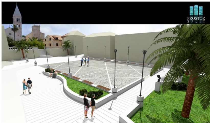
Slika 3. „Morski trg“, Supetar, Brač