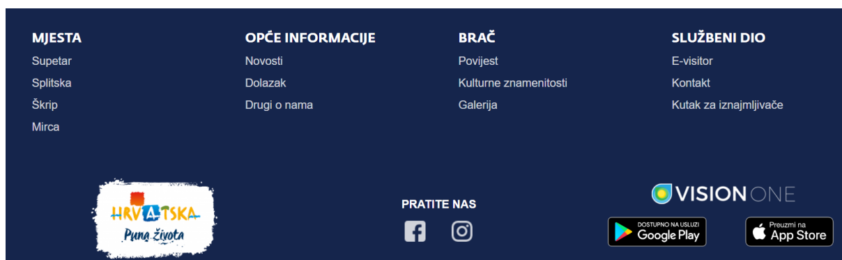
Slika 5. Početna strana internet stranice TZG Supetar