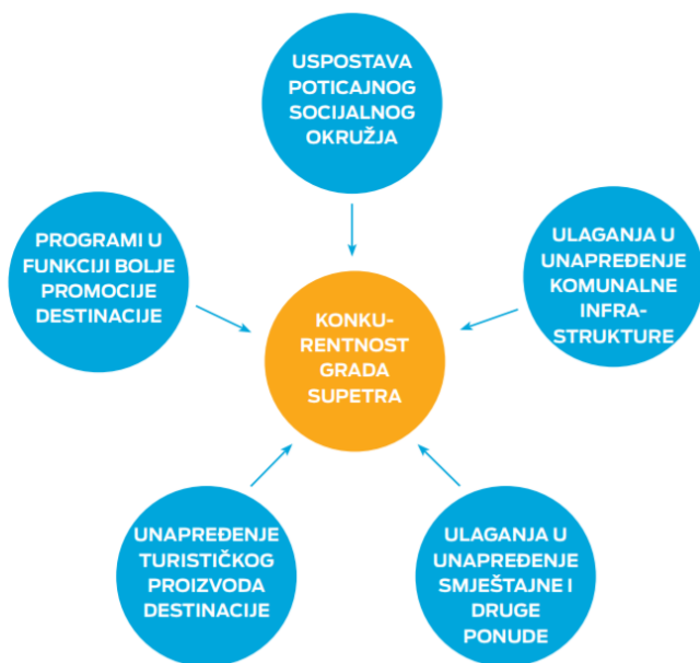
Slika 6. Područja podizanja konkurentnosti turizma grada Supetra