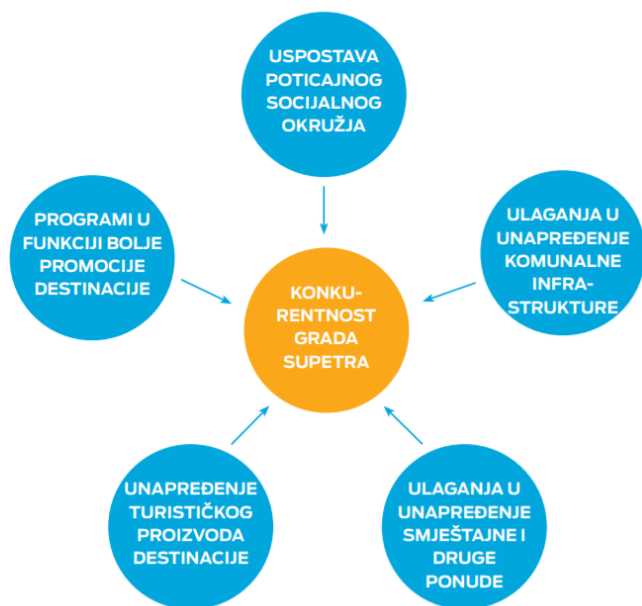
Slika 6. Područja podizanja konkurentnosti turizma grada Supetra