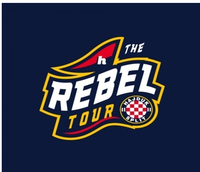
Slika 7: Logo “Dišpet ture”