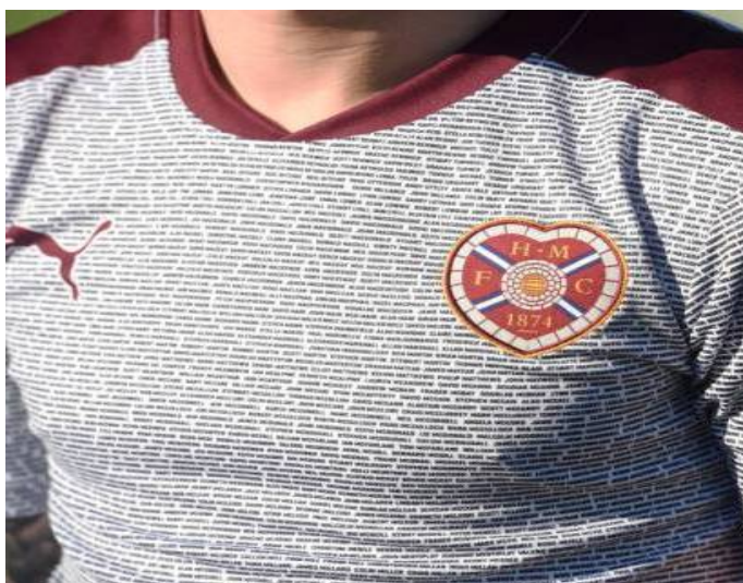
Slika 5: Imena navijača Heartsa na specijalnom dresu

Tako se Hajduk pridružio nekolicini klubova čiji članovi – donatori svoja imena imaju upisana na samom dresu svog kluba. Jedan od takvih klubova je i Heart of Midlothian Football Club (skraćeno Hearts) koji se svojim navijačima na doniranju za financijski spas kluba zahvalio tako što je imena njih čak 8.000 utkao na specijalni dres. Dres je prezentiran u rujnu 2015.godine, a upisana su imena svih onih koji su donirali minimalno 120 funti (oko 1000 kn). 11