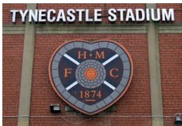
Slika 8: Tynecastle Stadium