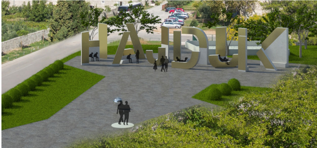
Slika 6: Idejno rješenje tematskog parka na Poljudu