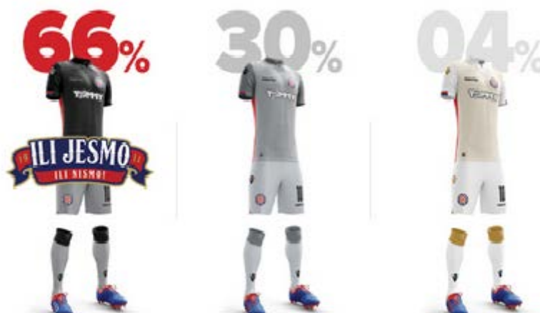
Slika 4: Rezultati glasanja donatora pri izboru treće garniture za sezonu 2017/2018.

Prvi u nizu projekata udruge Naš Hajduk simboličnog imena “Ili jesmo ili nismo” započeo je u listopadu 2016.godine. Kao što je već bilo navedeno u trećem poglavlju ovog rada, dugoročni cilj postojanja udruge je stjecanje vlasništva nad većinskim dijelom dionica HNK Hajduk Split. Ovom akcijom započet je proces otplate 24,53% dionica vrijednosti 35 milijuna kuna koje je tvrtka Tommy d.o.o prodala udruzi Naš Hajduk. Ovaj projekt je najveća i najuspješnija crowdfunding kampanja u povijesti Republike Hrvatske u kojoj su, u samo 48 dana, članovi – navijači donirali preko 4 milijuna kuna za otplatu prve rate dionica. (Otplata se vrši polugodišnje u iznosima od 1,8 milijuna kuna tokom 10 godina, odnosno kroz 20 rata op.a.). Kao znak zahvale donatorima, udruga je u dogovoru s Hajdukom otkupila pravo dizajna trećeg dresa, a na kojemu su utkana sva imena donatora koji su u već navedenoj akciji sudjelovali iznosima 1911 kn i/ili više. Osim toga, donatori su imali mogućnost biranja dizajna dresa pa su između tri ponuđene opcije izabrali crnu koja je tako postala službena treća garnitura za sezonu 2017./2018. 10