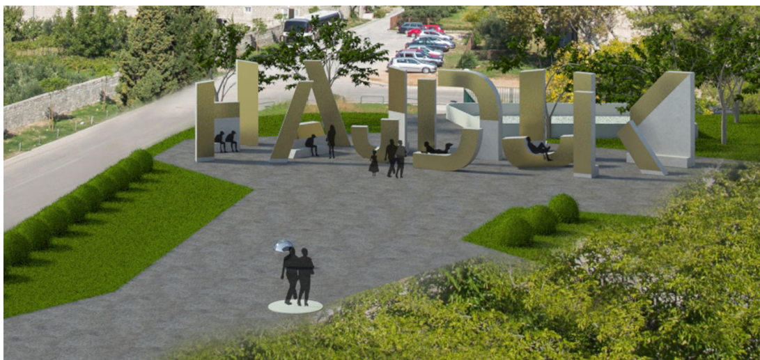
Slika 6: Idejno rješenje tematskog parka na Poljudu