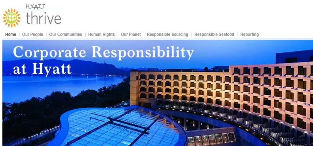
Slika 2: Hyatt thrive, globalna platforma Hyatt hotelske korporacije posvećena DOP-u

Kasnih 1990-ih godina, veliki međunarodni hotelski lanci pokrenuli su različite programe koji su im poslužili kao temelj za predstavljanje odgovornog poslovanja. Danas, većina velikih međunarodnih hotela na svojim internetskim stranicama objavljuje izvješća o DOP-u. 72 Veliki hotelski lanci sa snažnim brendom poput Marriotta, Hilltona, Radissona, Hyatta itd. na svojim službenim stranicama imaju i posebnu sekciju posvećenu DOP-u. 73