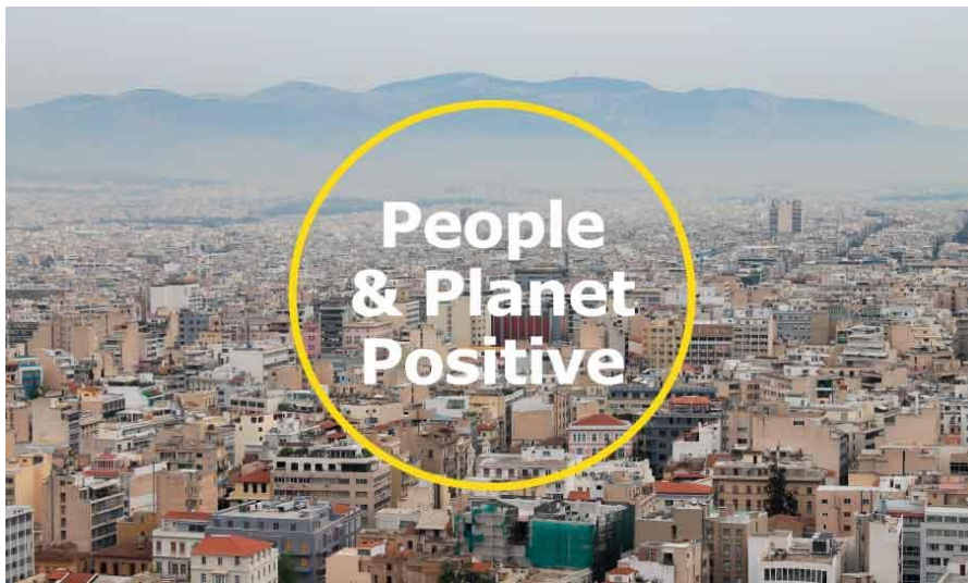
Slika 4: Ikea, Ljudi i planet

Održivost u IKEI znači osigurati ekološku, ekonomsku i socijalnu dobrobit za danas i sutra. To znači ispunjavanje potreba ljudi i društva, bez ugrožavanja sposobnosti budućih generacija da zadovolje svoje potrebe - djelujući u dugoročnim interesima mnogih ljudi, a ne samo nekolicine. Radi se o životu unutar granica planeta i zaštiti okoliša. To znači promicanje snažnog, zdravog, uključivog i pravednog društva u kojem ljudi mogu napredovati i ispuniti svoje potencijale.