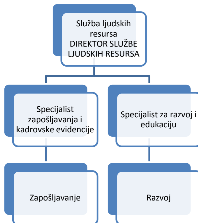
Slika 3. Organigram službe upravljanja ljudskim resursima;