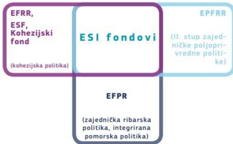
Slika 1: Pet ESI fondova