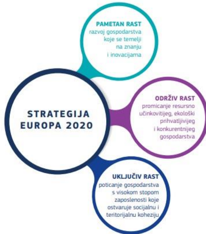
Slika 2: Strategije EUROPA 2020.