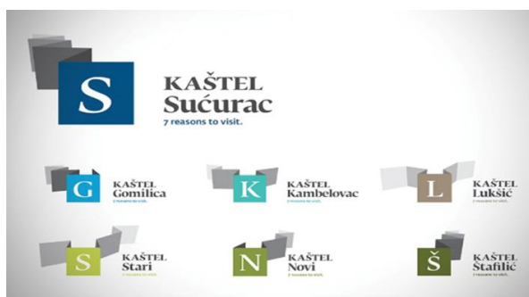
Slika 9: Prikaz svakog Kaštela u zasebnom polju unutar sustava

Vizualni identitet treba asociirati ciljne segmente na konkretnu destinaciju. Ovdje je glavni naglasak na dizajnu logotipa te isti nije direktno povezan s Kaštelima. Tek nakon što se pročita značenje novog vizualnog identiteta, moguće je stvoriti poveznicu s samim gradom i sadržajem koji nudi posjetiteljima. Također, važno je definirati mogu li Kaštela kao turistička destinacija pružiti posjetiteljima ono što je predstavljeno putem vizualnog identiteta. Potrebno je utvrditi koji se resursi mogu ponuditi kao turističke atrakcije obzirom da je za određene potrebna prethodna sanacija i revitalizacija (ukoliko govorimo o povijesnim građevinama, utvrdama). Također kada je riječ o crljenku kaštelanskom, potrebno je provesti projekt njegove revitalizacije i zaštite na području grada Kaštela obzirom da je većina kaštelanskih vinograda zapuštena te treba raditi na njihovoj obnovi i podizanju novih vinograda. Kao što je u teorijskom dijelu rada navedeno, marka turističke destinacije treba biti kreirana sustavno i u skladu s mogućnostima same destinacije. Novokreirani vizualni identitet neće polučiti uspjeh ukoliko destinacija tržištu ne može ponuditi ono što je obećano.