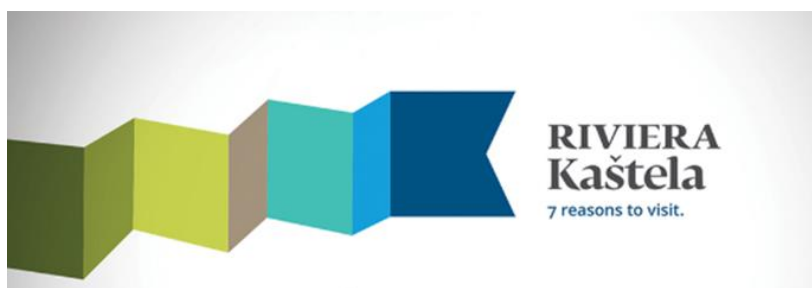
Slika 8: Novi vizualni identitet grada Kaštela

Glavnu ulogu u promociji, organizaciji turizma i turističkih događaja ima Turistička zajednica grada Kaštela kojoj je sjedište u Muzeju grada Kaštela u K. Lukšiću. Turistička zajednica promovira destinaciju grada Kaštela putem vlastite web stranice, promotivnih brošura, promotivnih turističkih proizvoda te putem društvenih mreža. Također, 2019. godine predstavljena je izložba 110 godina turizma u Kaštelima u Veleposlanstvu Republike Hrvatske u Londonu. Time je promovirana povijesno kulturna baština grada i crljenak kaštelanski svim zainteresiranim skupinama. Takvih inicijativa i suradnji bi trebalo biti više kako bi grad Kaštela bio prepoznat na tržištu kao zanimljiva turistička destinacija s bogatom prošalošću. U cilju postizanja veće vidljivosti i bolje konkurentske pozicije na tržištu kreiran je i novi vizualni identitet grada Kaštela. Kako bi se poboljšali dosadašnji turistički rezultati uočena je potreba za sustavnom komunikacijom vrijednosti svih sedam Kaštela kao jedne, jedinstvene cjeline zbog čega je formiran i novi slogan koji glasi: Sedam razloga za posjetu. Novim vizualnim identitetom predstavljeni su prepoznati (najjači) identitetski potencijali unutar destinacije. Novi logo je prikazan u obliku zastave koja simbolizira dinamičnost i ritam, a polazišna točka zastave je forma koja opisuje bridove utvrda, odnosno kaštela.