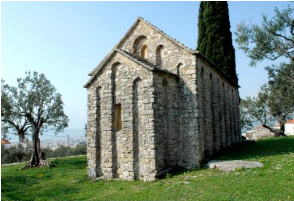
Slika 12: Crkva sv. Jurja od Raduna

u njoj prvi put spominje Hrvatsko ime knez Hrvata. Zatim crkva sv. Jurja od Žestinja koja potječe iz 12. stoljeća, oko crkve se nalazi staro groblje s očuvanim stećcima. Crkva Gospe od Stomorije gdje se nalazi i Biblijski vrt koji je utemeljen u čast dolaska pape Ivana Pavla II. Nadalje, crkva sv. Jurja od Raduna iz 9. stoljeća kao rijetki primjer crkve sačuvane u svom izvornom obliku, crkva sv. Lovre od Ostroga u Kaštel Lukšiću te crkva sv. Ivana Birnja koja je sagrađena na ilirskoj Gradini. U Kaštel Kambelovcu se nalazi crkva sv. Martine od Kruševka, a sjeverno na predjelu Lažane nalazi se srednjovjekovna crkvica sv. Mihovila. U K. Gomilici je poznata crkvica sv. Kuzme i Damjana koja potječe iz 12. stoljeća. U Kaštel Sućurcu na obroncima Kozjaka nalaze se ostaci predromaničke crkve sv. Jurja od Putalja koja potječe iz 9. stoljeća, dok se na istočnom vrhu Kozjaka nalazi crkvica sv. Luke s nadgrobnim stećcima (Portal za kulturni turizam, Muzej grada Kaštela, 2019)