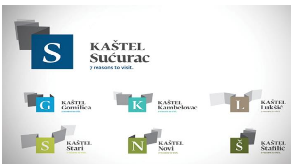
Slika 9: Prikaz svakog Kaštela u zasebnom polju unutar sustava

Vizualni identitet treba asociirati ciljne segmente na konkretnu destinaciju. Ovdje je glavni naglasak na dizajnu logotipa te isti nije direktno povezan s Kaštelima. Tek nakon što se pročita značenje novog vizualnog identiteta, moguće je stvoriti poveznicu s samim gradom i sadržajem koji nudi posjetiteljima. Također, važno je definirati mogu li Kaštela kao turistička destinacija pružiti posjetiteljima ono što je predstavljeno putem vizualnog identiteta. Potrebno je utvrditi koji se resursi mogu ponuditi kao turističke atrakcije obzirom da je za određene potrebna prethodna sanacija i revitalizacija (ukoliko govorimo o povijesnim građevinama, utvrdama). Također kada je riječ o crljenku kaštelanskom, potrebno je provesti projekt njegove revitalizacije i zaštite na području grada Kaštela obzirom da je većina kaštelanskih vinograda zapuštena te treba raditi na njihovoj obnovi i podizanju novih vinograda. Kao što je u teorijskom dijelu rada navedeno, marka turističke destinacije treba biti kreirana sustavno i u skladu s mogućnostima same destinacije. Novokreirani vizualni identitet neće polučiti uspjeh ukoliko destinacija tržištu ne može ponuditi ono što je obećano.