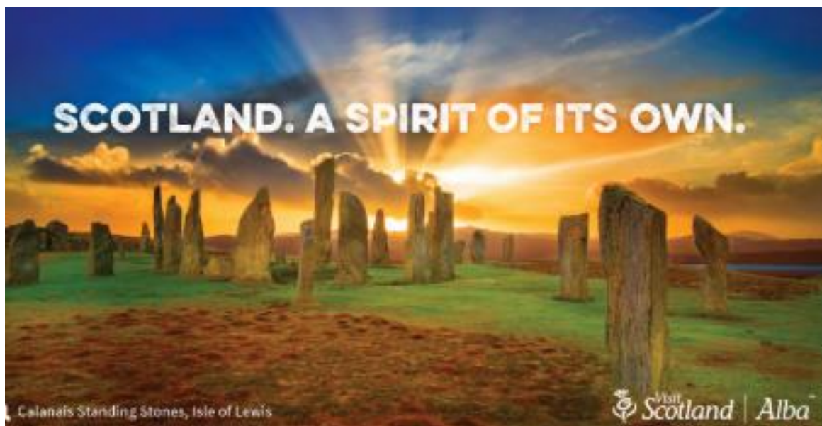
Slika 2: Turistički slogan Škotske