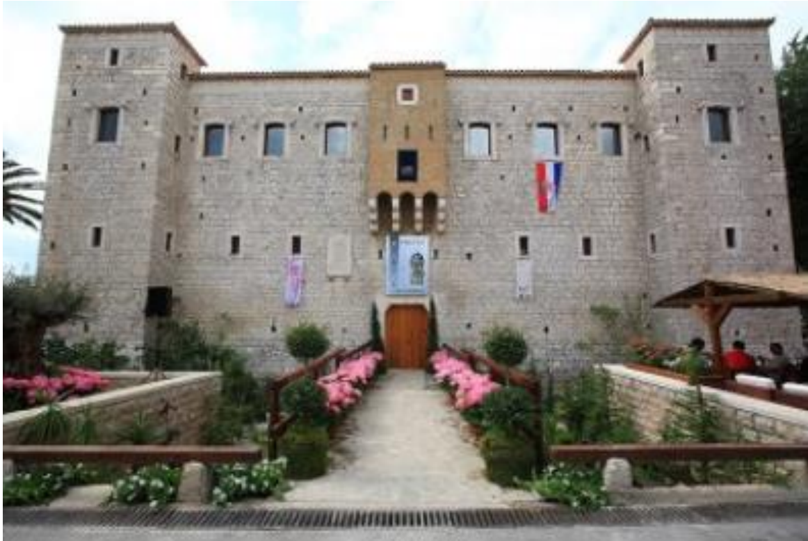
Slika 15: Muzej grada Kaštela (utvrda Vitturi)