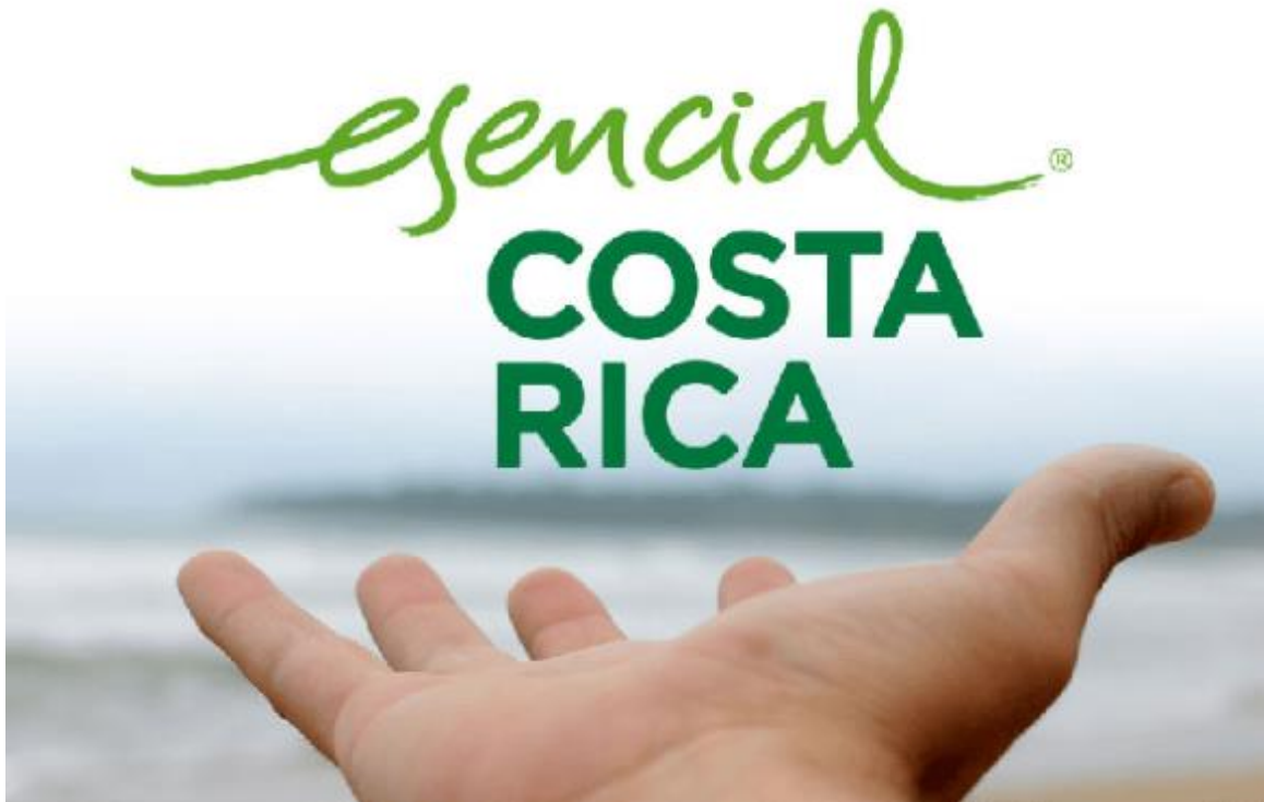
Slika 7: Logo turizma Kostarike

dana. Prema rezultatima istraživanja Kostarika kao brand privlači poslovna ulaganja i značajan broj turista u destinaciju u usporedbi s ostalim konkurentima Latinske Amerike (The Tico Times, 2017).