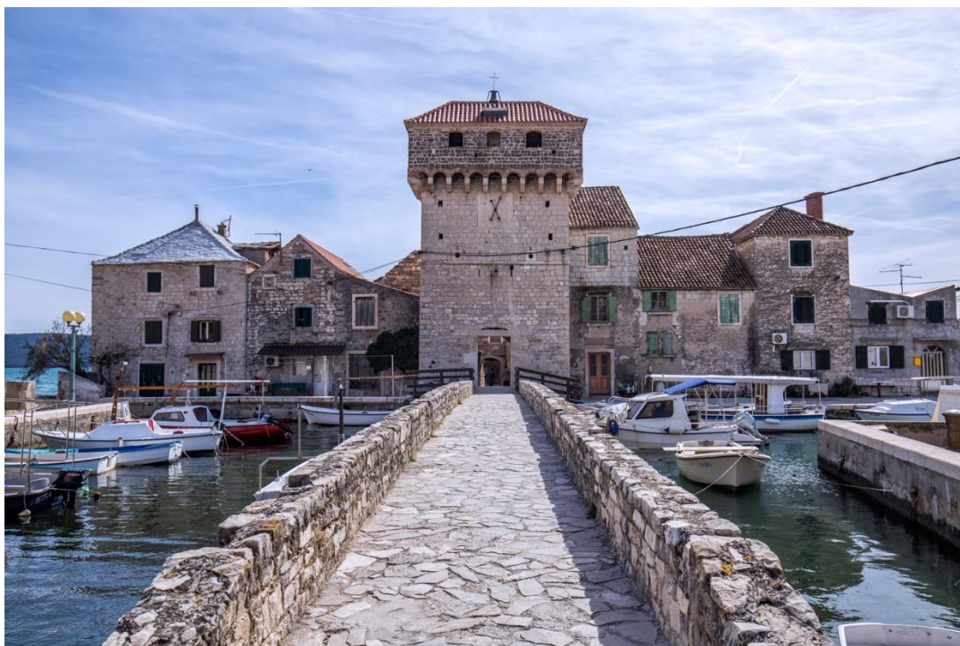
Slika 13: Kaštilac u Kaštel Gomilici