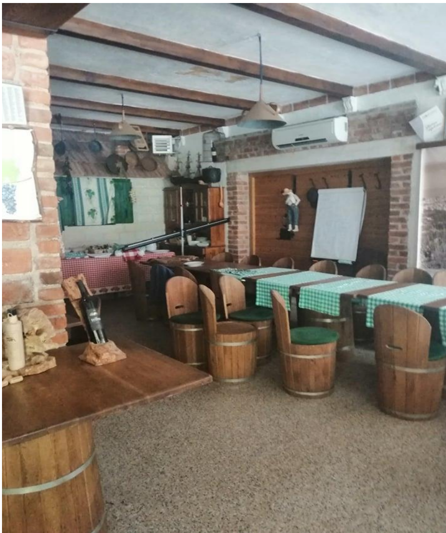
Slika 17: Kušaonica obitelji Bedalov u Kaštel Kambelovcu

Gospodin Bedalov je objasnio kako izgleda jedan turistički obilazak njegovog OPG-a: "Gosti prvo dolaze u našu kušaonicu u Kaštel Kambelovcu, tu kušaju 10-ak vrsta domaćih rakija. Nakon toga ih vodimo s kombijem do vinograda na Kozjaku gdje također imamo kušaonicu. Tamo im pripremamo tri kaštelanska tradicionalna jela koja se dobro vezuju uz tri naša domaća vina. Uz svako jelo i vino gostima prezentiramo priču o njihovom nastanku, pripremi i zašto se to jelo služi upravo uz tu sortu vina. Do sada su uvijek bili zadovoljni našom uslugom." Vinar navodi kako njegovu vinariju većinski posjećuje američko tržište s čak 85% udjela u ukupnoj strukturi gostiju. To su, kako ističe, gosti koji jednom dođu u posjet ali prenose svoje doživljaje i iskustvo prijateljima i rodbini koji nakon toga odluče posjetiti njegov OPG.