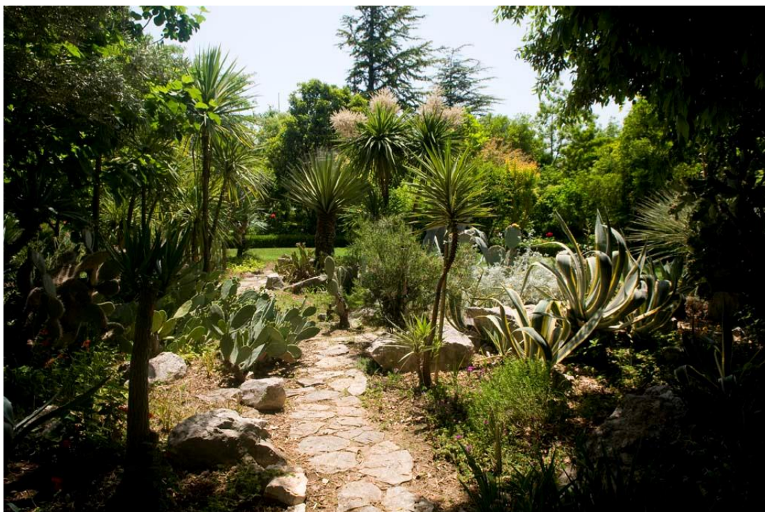
Slika 11: Botanički vrt u Kaštel Lukšiću