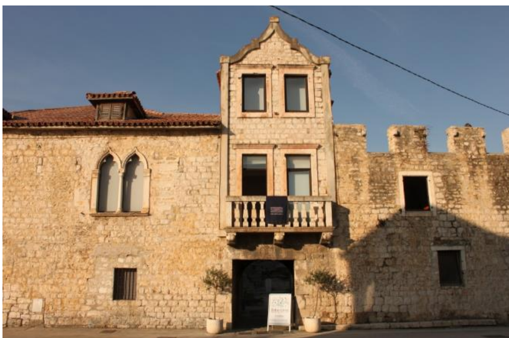
Slika 14: Kaštilac u Kaštel Sućurcu