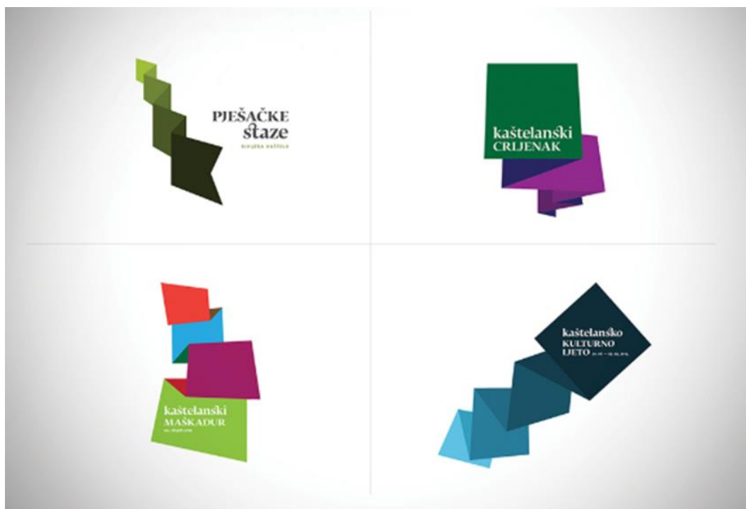
Slika 10: Primjena novog vizualnog identiteta u širem kontekstu