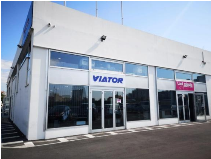
Slika 4. Sjedište tvrtke u Splitu