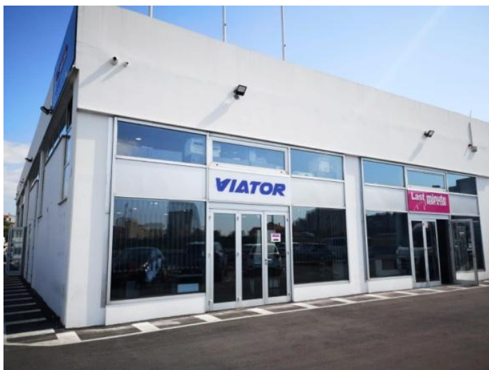
Slika 4. Sjedište tvrtke u Splitu