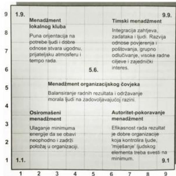
Slika 3. Menadžerska mreža Blakea i Moutona

Menagerial Grid , odnosno menadžerska mreža je model vodstva koji su razvili Blake i Mouton na temelju rezultata dobivenih Ohio State istraživanjima. Modelu koji se temelji na dvije dimenzije- orijentacija na ljude i orijentacija na proizvodnju, autori dodaju i treću dimenziju, a to je motivacija koja presijeca mrežu pod pravim kutom u određenim točkama kombinacije prvih dviju dimenzija.