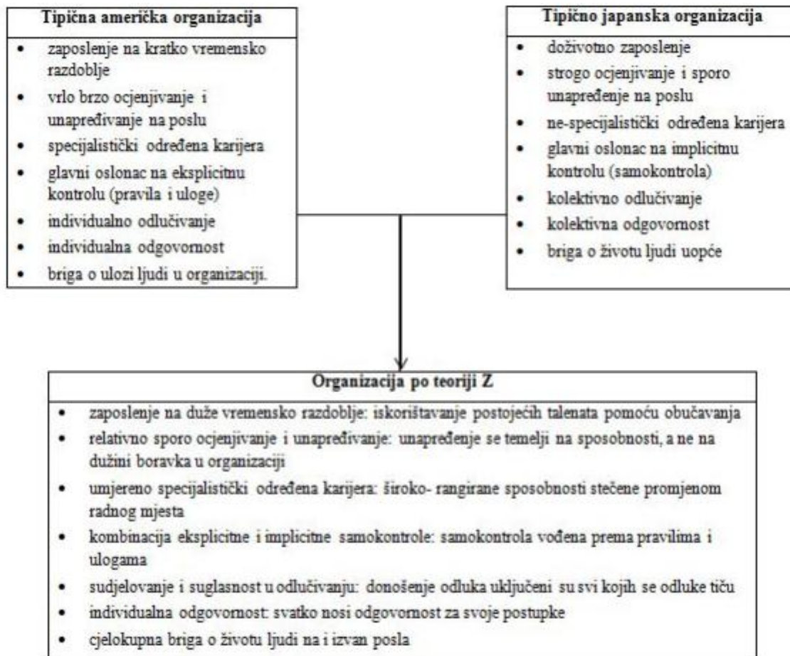
Slika 2. Ouchijev model organizacije po teoriji „Z“

Izvor: Žugaj, M. (2004.): “Organizacijska kultura”, TIVA tiskara, Varaždin; str. 20.