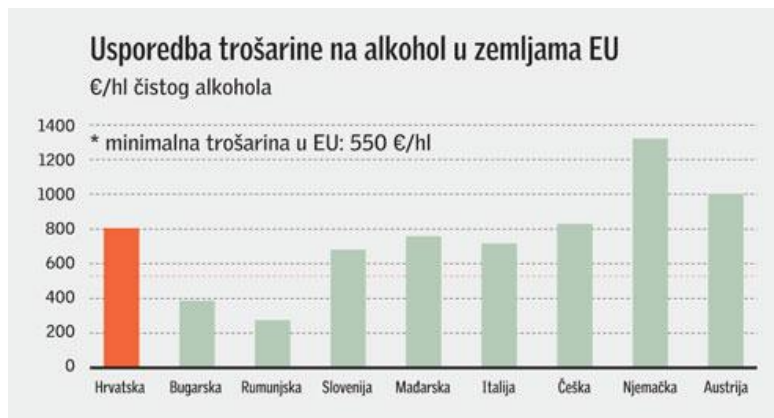
Slika 1 – usporedba trošarine na alkohol u zemljama EU