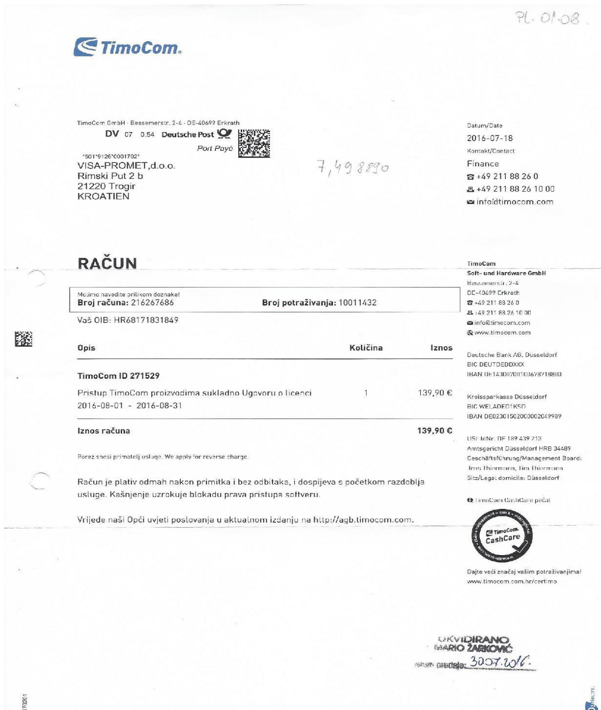
Slika 5: Priljeni račun od tvrtke TimoCom Ltd

Pomnožimo li dobiveni iznos sa stopom od 25% dobijemo iznos 262,27 kuna koji za Visa Promet ujedno predstavlja i pretporez i obvezu za PDV temeljem prijenosa porezne obveze na njega kao primatelja usluge.