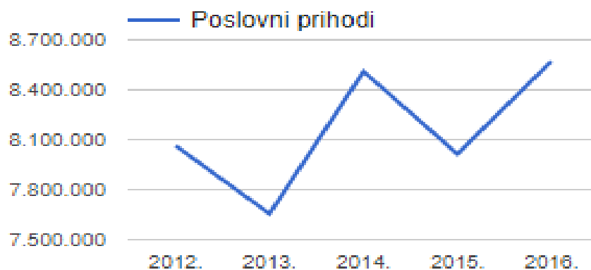
Slika br. 3.: Poslovni prihodi poduzeća u razdoblju od 2012. do 2016. godine

Mjere likvidnosti su društvu iznimno bitne kako bi u svakom trenutku moglo udovoljiti, odnosno podmiriti kratkoročne obveze. Koeficijent tekuće likvidnosti ustvari pokazuje u kojoj mjeri tekuća aktiva pokriva obveze iz tekuće pasive, odnosno u kojoj mjeri radno raspoloživi kapital garantira da će sve tekuće obveze biti podmirene.