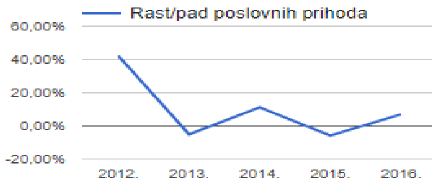
Slika br. 4.: Rast / pad poslovnih prihoda u razdoblju od 2012. do 2016. godine

Na slici br. 3. su prikazani poslovni prihodi poduzeća Metal Sint d.d. Vidljive su oscilacije poslovnih prihoda, koji su sa razine od 8.100.000 kn u 2012. godini pali na 7.500.000 kn u 2013. g., kako bi u 2014. dosegli tadašnji vrhunac od 8.500.000 kn. 2015. godine se opet snižavaju na 8.000.000 te u 2016. dosežu vrijednost od 8.600.000 kn, koja je ujedno najviša vrijednost u prikazanom vremenskom razdoblju.