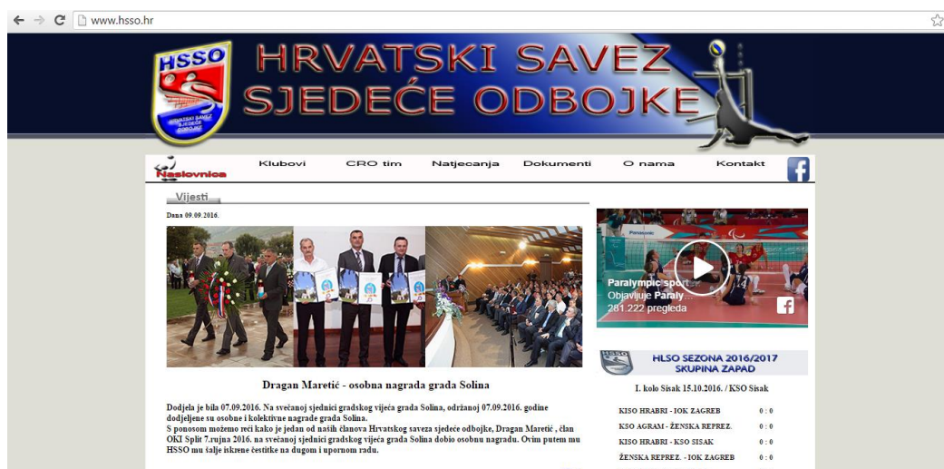
Slika 11 : Službena stranica hrvatskog saveza sjedeće odbojke

Preuzeto sa službene stranice hrvatskog saveza sjedeće odbojke, Hrvatski savez sjedeće odbojke (HSSO) osnovan je 2006. godine na temeljima duge povijesti igranja sjedeće odbojke i rada entuzijasta u Hrvatskoj koja seže od 1969. godine. Punopravna su članica Hrvatskog paraolimpijskog odbora kao najviše nevladine nacionalne sportske udruge sportaša s invaliditetom u Hrvatskoj. Glavni ciljevi i djelatnosti HSSO su poticanje i promicanje sjedeće odbojke i sporta osoba s invaliditetom, usklađivanje aktivnosti svojih članica, organiziranje i provođenje natjecanja sjedeće odbojke u Hrvatskoj, uređivanje pitanja koja se odnose na registraciju sportaša i sportskih djelatnika u sjedećoj odbojci te stegovne odgovornosti sportaša i sportskih djelatnika.