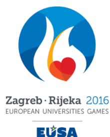
Slika 4 : Europske sveučilišne igre Zagreb – Rijeka, 2016