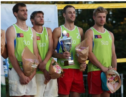
Slika 6: Slovenski pijeskaši