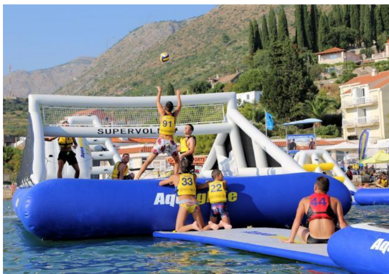
Slika 14 : Odbojka na trampolinu