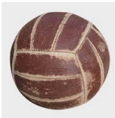
Slika 8 : Prva odbojkaška lopta