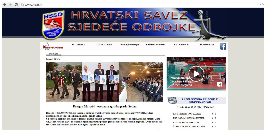
Slika 11 : Službena stranica hrvatskog saveza sjedeće odbojke

Preuzeto sa službene stranice hrvatskog saveza sjedeće odbojke, Hrvatski savez sjedeće odbojke (HSSO) osnovan je 2006. godine na temeljima duge povijesti igranja sjedeće odbojke i rada entuzijasta u Hrvatskoj koja seže od 1969. godine. Punopravna su članica Hrvatskog paraolimpijskog odbora kao najviše nevladine nacionalne sportske udruge sportaša s invaliditetom u Hrvatskoj. Glavni ciljevi i djelatnosti HSSO su poticanje i promicanje sjedeće odbojke i sporta osoba s invaliditetom, usklađivanje aktivnosti svojih članica, organiziranje i provođenje natjecanja sjedeće odbojke u Hrvatskoj, uređivanje pitanja koja se odnose na registraciju sportaša i sportskih djelatnika u sjedećoj odbojci te stegovne odgovornosti sportaša i sportskih djelatnika.