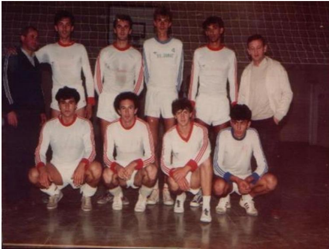
Slika 9: Momčad Mladosti 1987.godine