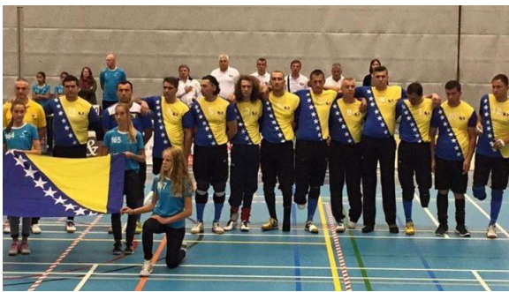
Slika 7: Reprezentacija BIH u sjedećoj odbojci