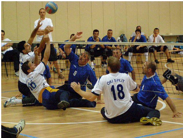
Slika 12: Detalj s utakmice Zadar - Split