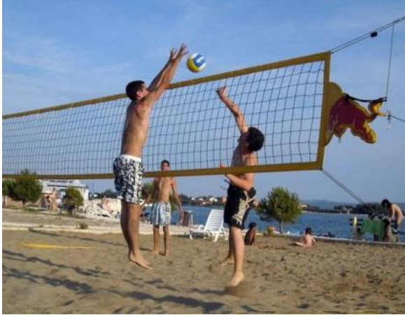
Slika 5 : Odbojkaški teren na Žnjanu