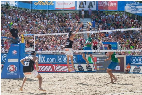
Slika 3 : Beach volleyball major Poreč series