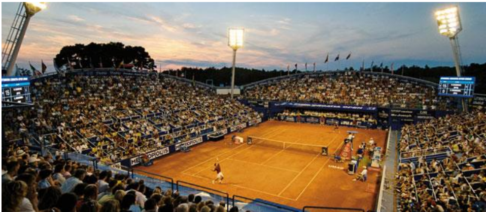
Slika 1: ATP Croatia Open Umag