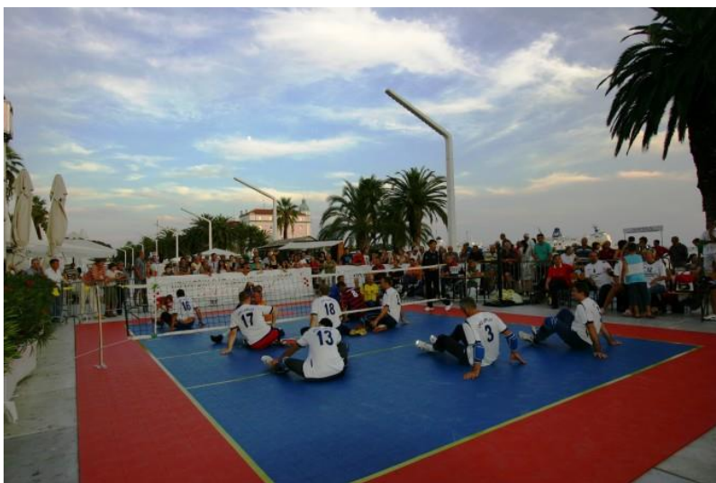
Slika 13: Odbojkaški klub invalida Split na Rivi