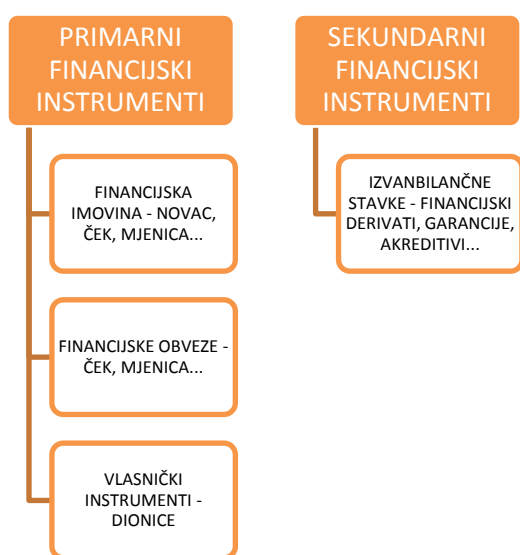
Slika 2. Vrste financijskih instrumenata

Financijski su instrumenti pisani dokumenti koji u principu zamjenjuju novac. Prema Orsagu (Orsag, 2011.), „financijski su instrumenti, u najširem smislu riječi, ugovori u kojima su sadržana prava i obveze iz nekog financijskog odnosa. Stoga se financijsko tržište može definirati i kao mjesto na kojem se obavlja promet financijskim instrumentima“. Osim toga takvi ugovori predstavljaju financijsku obvezu prema onima koji su ih izdali a s druge strane, potraživanja za imatelja istih. Financijski instrumenti mogu se podijeliti na primarne ili sekundarne (kako je prikazano na slici 2.).