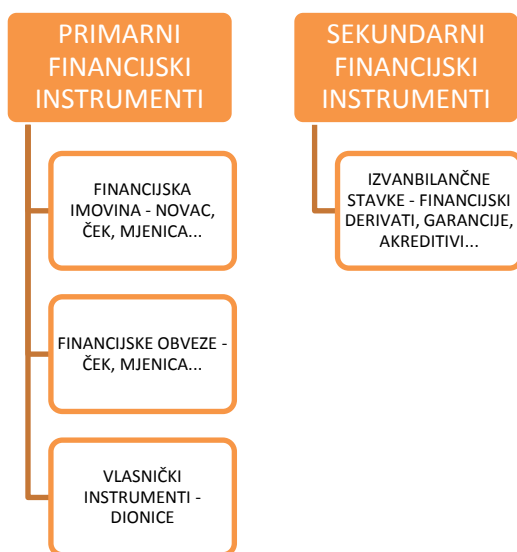
Slika 2. Vrste financijskih instrumenata

Financijski su instrumenti pisani dokumenti koji u principu zamjenjuju novac. Prema Orsagu (Orsag, 2011.), „financijski su instrumenti, u najširem smislu riječi, ugovori u kojima su sadržana prava i obveze iz nekog financijskog odnosa. Stoga se financijsko tržište može definirati i kao mjesto na kojem se obavlja promet financijskim instrumentima“. Osim toga takvi ugovori predstavljaju financijsku obvezu prema onima koji su ih izdali a s druge strane, potraživanja za imatelja istih. Financijski instrumenti mogu se podijeliti na primarne ili sekundarne (kako je prikazano na slici 2.).