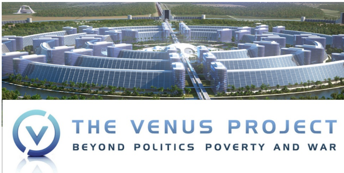
Slika 3. Venus projekt

Venus projekt poziva na redizajn trenutno poznate kulture življenja gdje su ratovi, siromaštvo, glad, dugovi te sva nepotrebna ljudska patnja (jer Venus projekt već provodi rješenja za navedene probleme iskorištavanjem prirodnih resursa koje daje društvu korištenjem postojeće tehnologije) uvelike rješivi problemi društva: postoje, moguće ih je riješiti, i apsolutno su neprihvatljivi. Sve manje od ovoga će rezultirati kontinuiranim nastavljanjem ponavljanja zatvorenog kruga problema koji se poduzimanjem minimalnih radnji po pitanju rješavanja tih problema i dalje nepobitno zadržavaju unutar današnje kulture življenja.