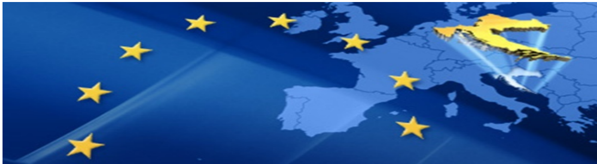
Slika 2. Fondovi Europske unije