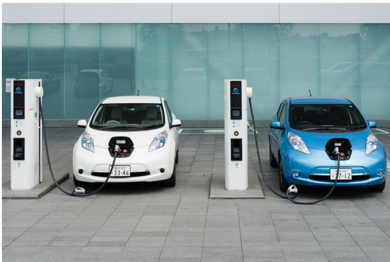
Slika 1. Električni automobili

Ideja električnog automobila (Slika 1.) započinje između 1832. i 1839. godine, kada je Robert Anderson konstruirao prvi električni automobil koji kao izvor električne energije koristi ne punjive baterije.