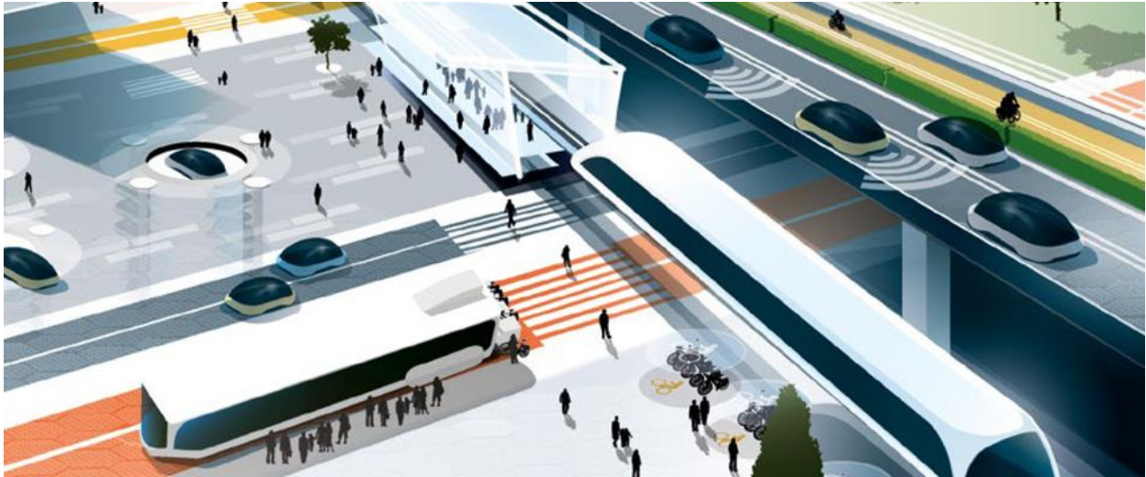
Slika 2. Grad Glasgow