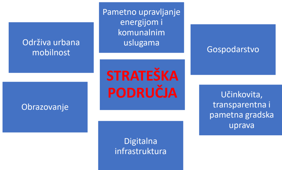
Slika 4. Strateška područja Zagreba kao pametnog grada