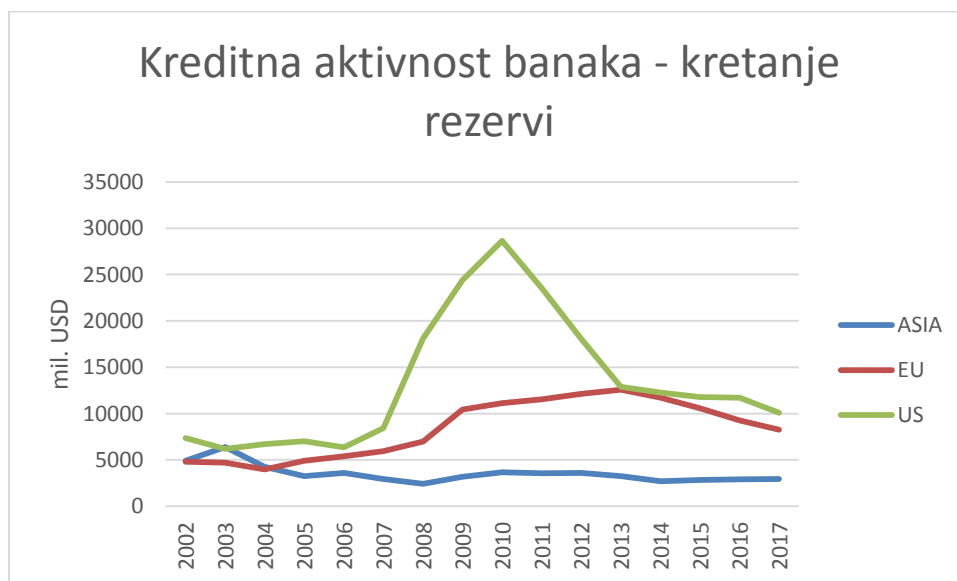
Graf 3: Kreditna aktivnost banaka – kretanje rezervi