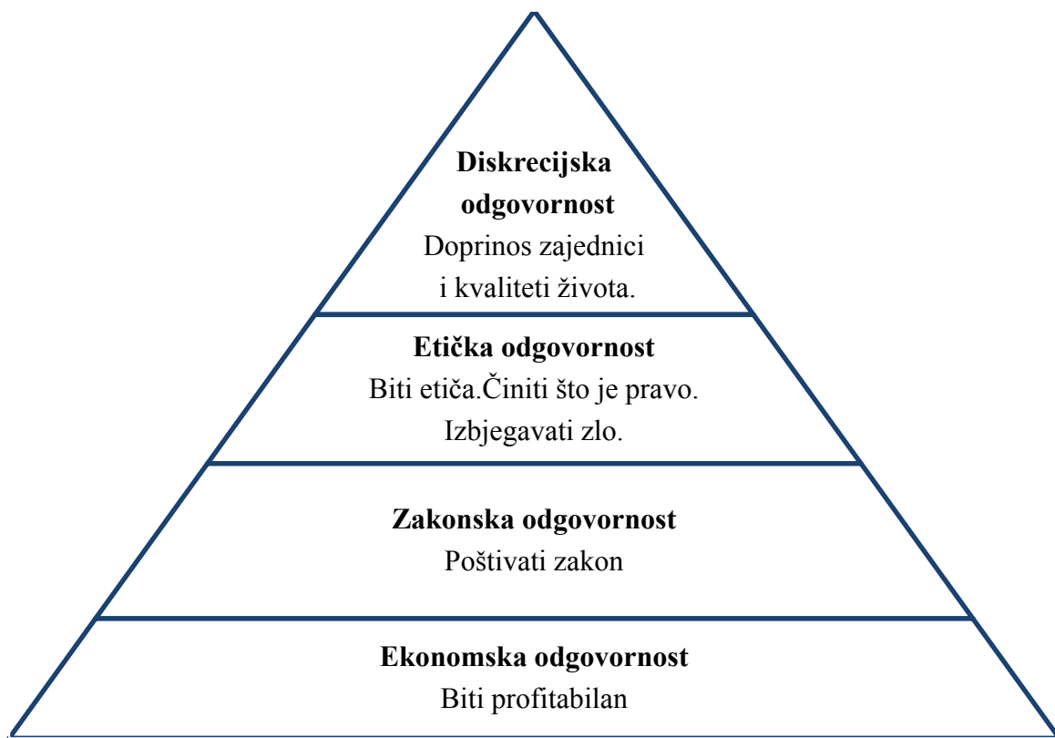
Slika 1: Hijerarhija društvene odgovornosti poduzeća