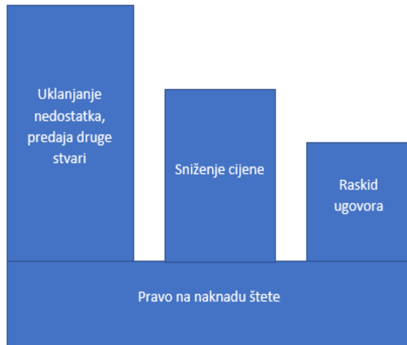
Slika 3: hijerarhijski prikaz kupčevih prava